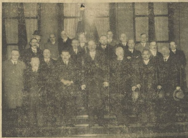
EL NUEVO GOBIERNO FLANDIN

De aquí a la fecha en que el Homenaje se celebra hay tiempo para llevar a cabo esa labor que indicamos. Con un poco de esfuerzo en el trabajo preparatorio se conseguirá la intensificación de una empresa que, como la que comentamos, eleva a las sociedades en que se desarrolla y dignifica y honra a sus ejecutores.