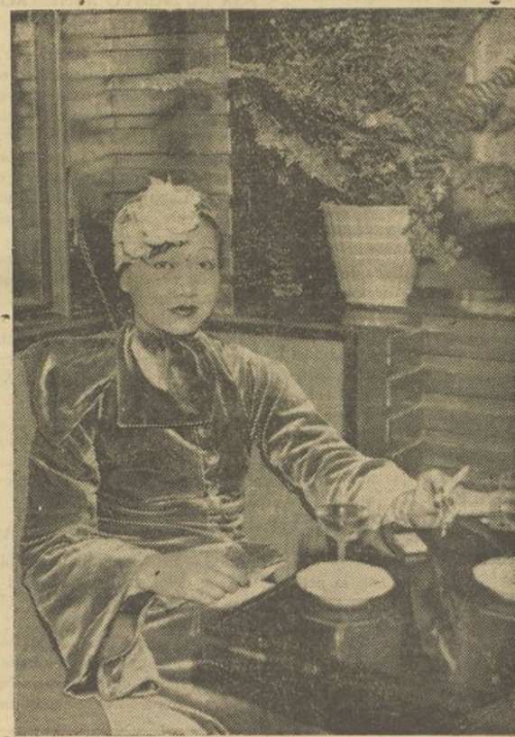
ANNA MAY WONG EN PARIS

La célebre actriz cinematográfica china, Anna May Wong, ha fi-jado su residencia en París. Su actual domicilio es de un refiná-dimo gusto moderno con reminiscencias orientales. Anna May en su "te room".