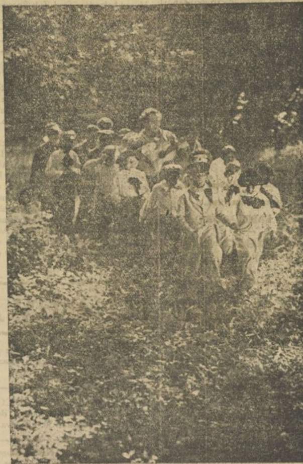
Uno de los momentos de la maravillosa producción British International "Al llegar la primavera" que distribuye "Cifesa"