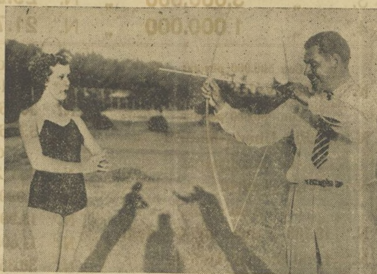
CAMPEÓN DE GOLF Y ARQUEO