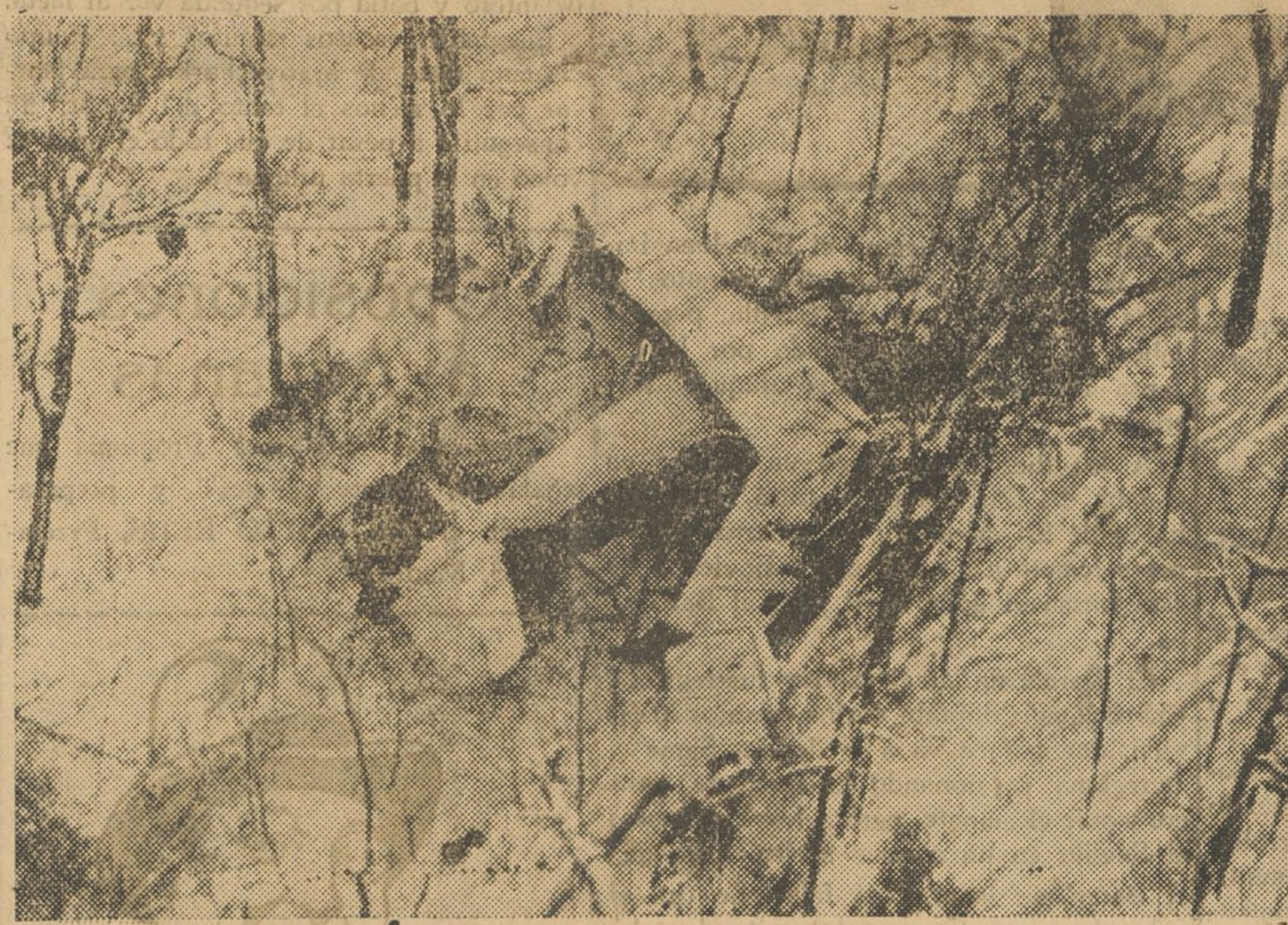
ESPANTOSO CRIMEN EN UNA ALDEA LITUANA

Este número ha sido visado por la censura