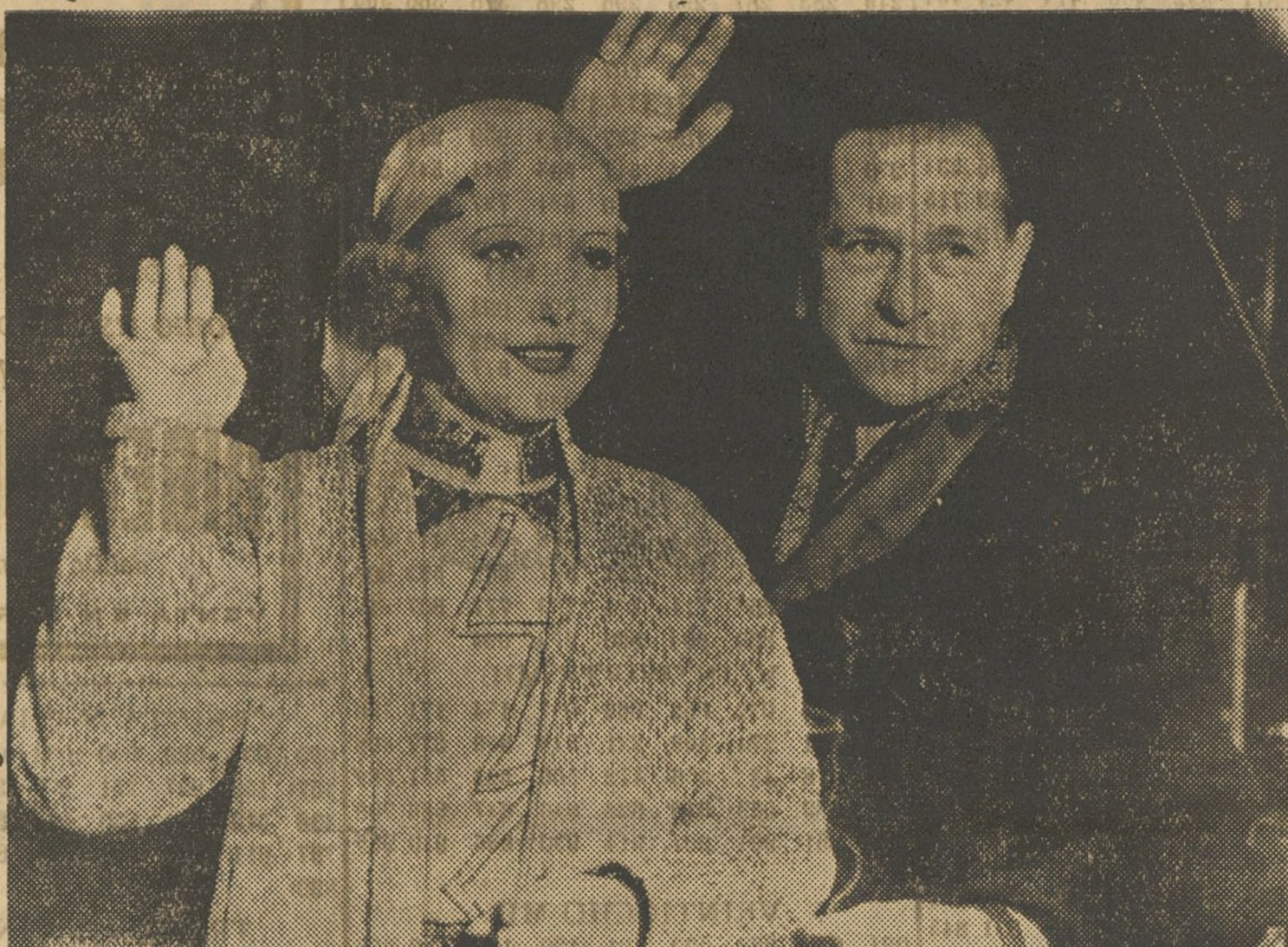
UNA ESTRELLA DE CINE, SE CASA ENTRE "DOS TOMA DE VISTAS"