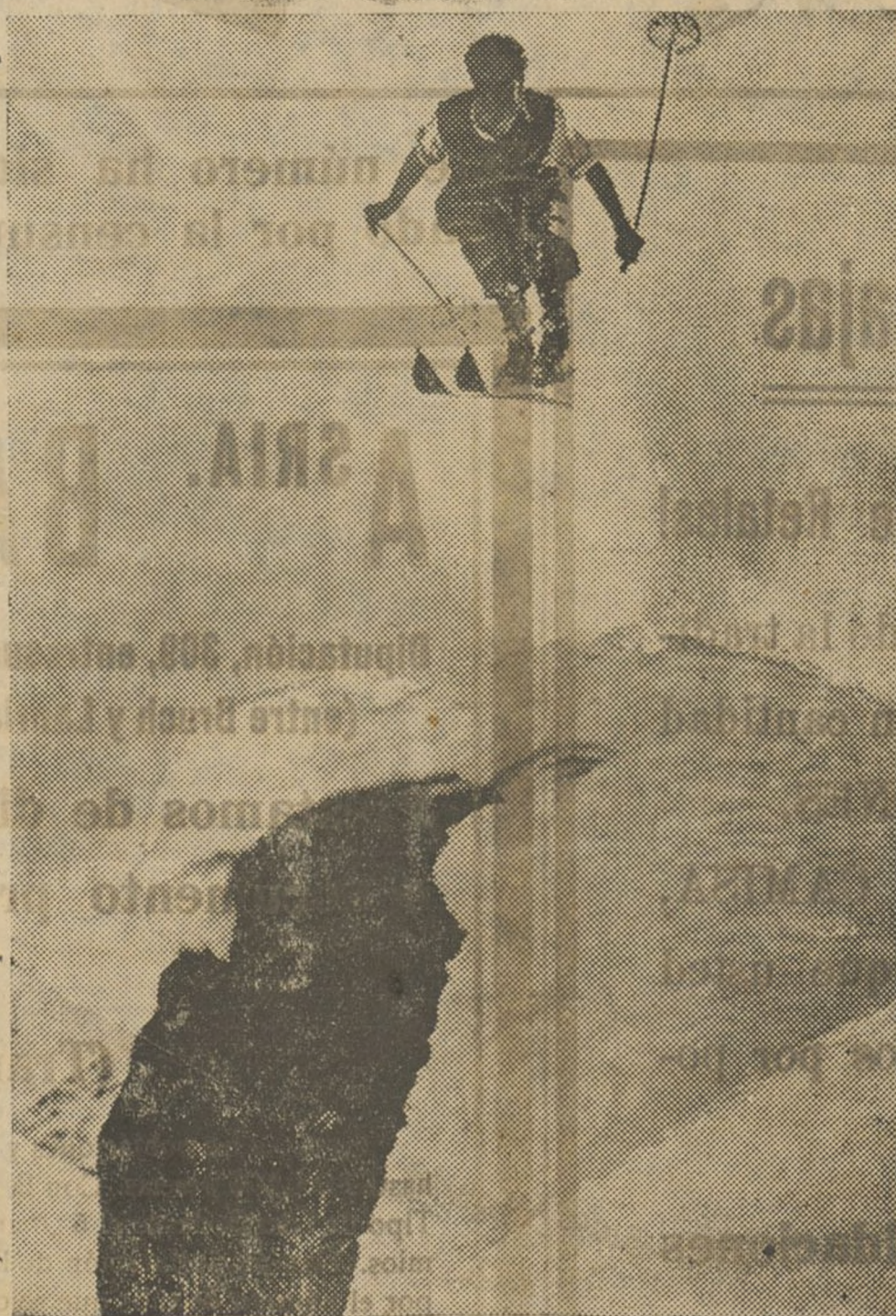
DEPORTES DE INVIERNO

La Plana, 0; Levante, 0. Malacitano, 3; Elche, 1. Murcia, 0; Hércules, 0. Gimnástico, 0; Granada, 2.