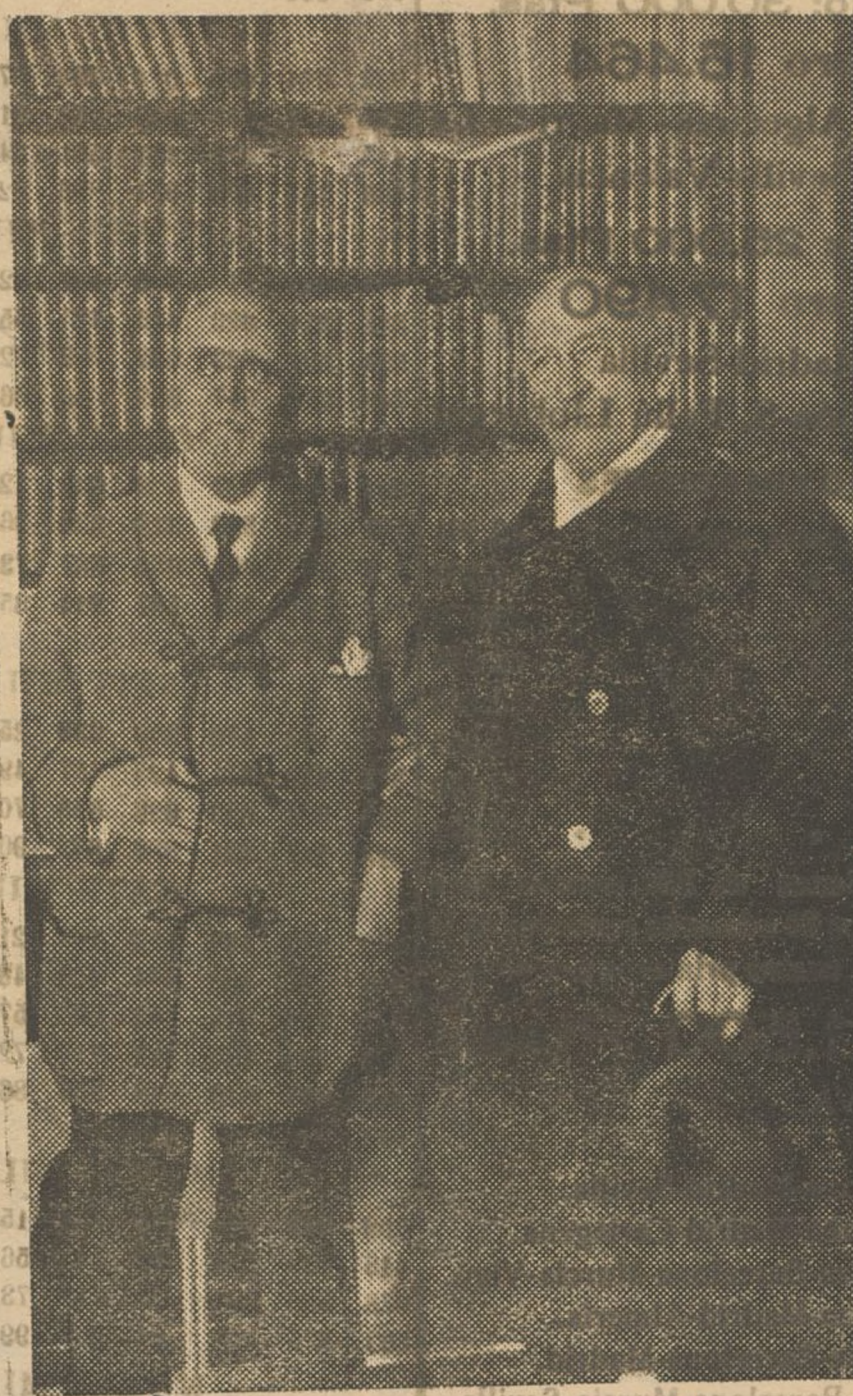
DE LA MUERTE DEL SEÑOR SANCHEZ GUERRA

El señor Sánchez Guerra con el señor Lerroux, fotografiado hace pocos meses en su domicilio.