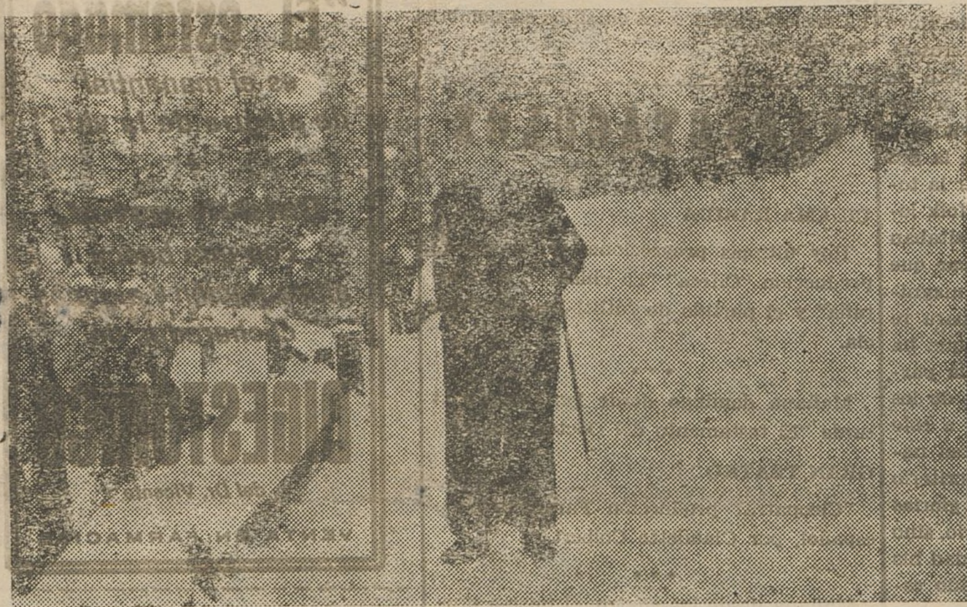
EL MINISTRO DE NEGOCIOS EXTRANJEROS DE RUMANIA, EN SUIZA

En el centro mundial de Sports de Invierno, St. Moritz, el Sr. Titulesco, el conocido político rumano, está descansando de sus trabajos, y se dedica, a los sports de invierno para aprovechar sus cortas vacaciones.