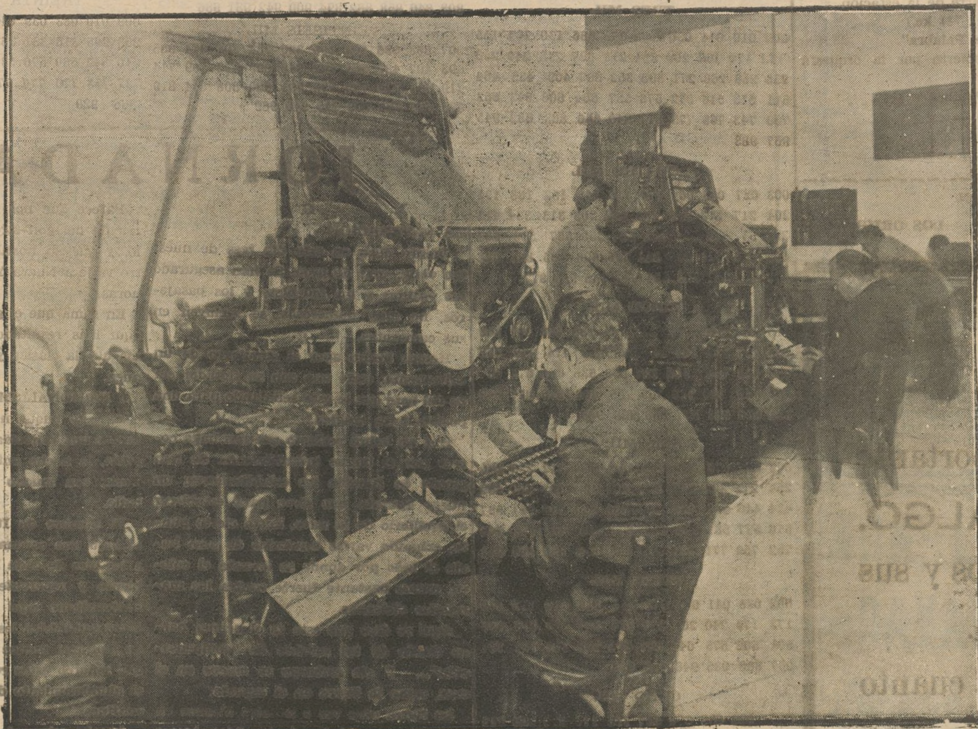
Un aspecto de nuestra sala de linotipias tal como ha quedado instalada