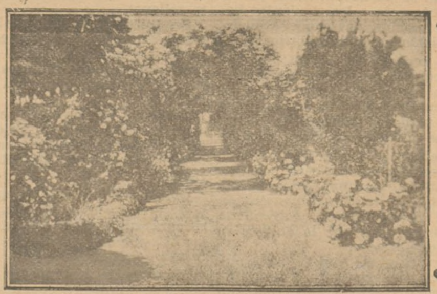
De la Avenida de Siurot