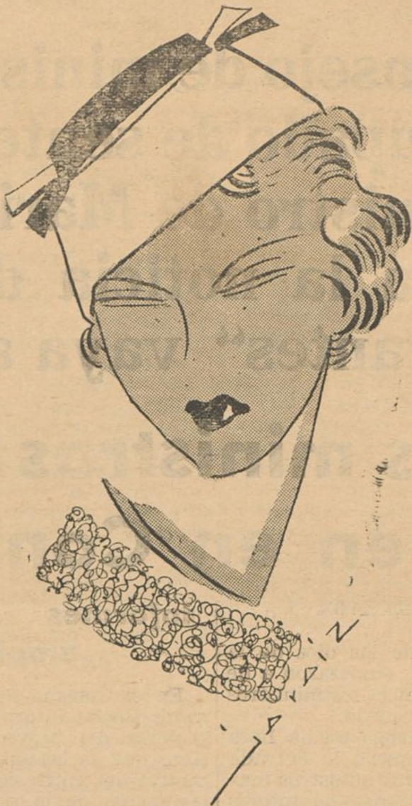
Muy moderno sombrerito de "taupe" blanco y cinta "gros grain" negra.

Este cock-tail, en La Habana, suelen poner una cucharada de grandina y servirlo en caso grande, terminándolo de llenar con sifón.