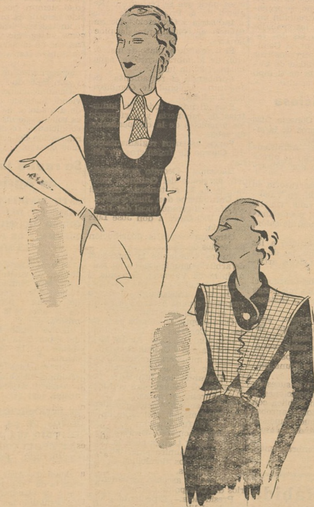
Elegante chaleco para complemento de un traje mañanero. Bonito cuerpo para traje, confeccionado con "glace" azul y tejido de hilo blanco a cuadraditos azules.

Cuidar ante todo el buen funcionamiento del estómago y de los intestinos y del corazón si se quiere evitar los barrillos que tanto afean el rostro.