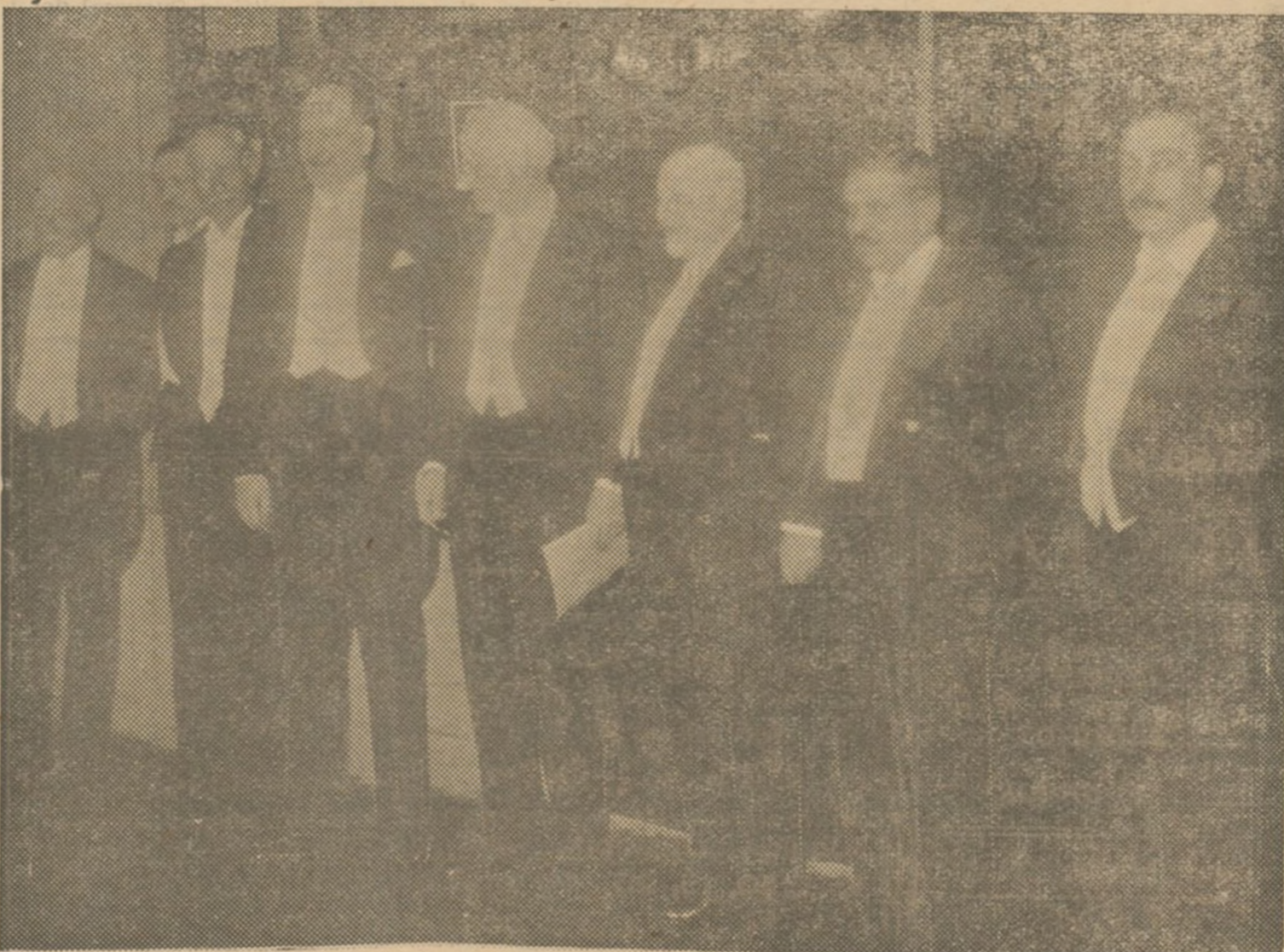
Los ministros de Estado de Francia e Inglaterra, juntamente con otras personalidades diplomáticas, «posan» después de su reciente entrevista en Londres.

[DE LA ENTREVISTA EN LONDRES DE MONSIEUR LAVAL Y MR FLANDING