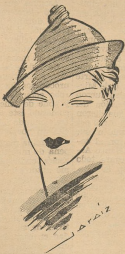
Una de las últimas creaciones en sombreros.

Debe tenerse presente también que todas las porciones detalladas no deben ser nunca exageradas.