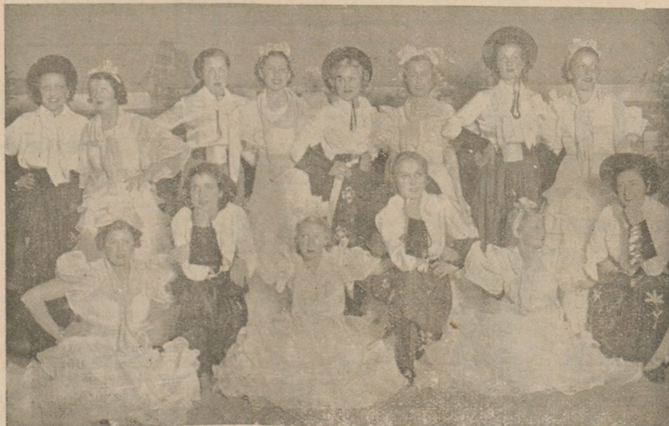
Grupo de distinguidas señoritas onubenses que bailaron un "pericón argentino" como fin de fiesta.

DEL FESTIVAL BENÉFICO CELEBRADO EN EL GRAN TEATRO