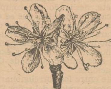
FLOR DE CIRUELO

Se multiplica por siembra, por hijuelos y por injerto. La semilla reproduce bien las variedades «claudias» «miraves» y «damasquinas». Estratificadas tan luego se recolectan, se siembra a principio de la primavera inmediata. Los hijuelos constituyen un medio rápido, pero poco recomendable porque los pies así obtenidos arraigan superficialmente y serpean mucho. El estaquillado se emplea con éxito en la variedad «claudia verde». Para el injerto se emplea comunmente la variedad «San Juan» aunque su periodo de aplicación es muy corto. El «miravolano» es conveniente en los suelos muy calizos y en los de viga. El procedimiento se guido es el de escudete al dormi-