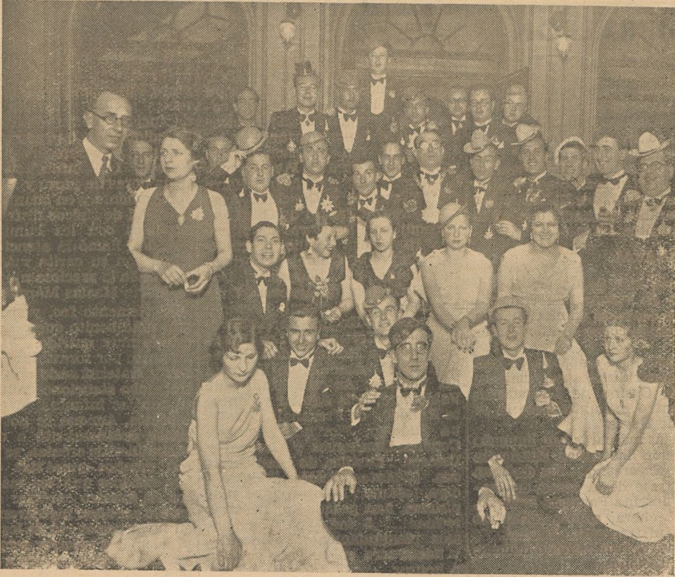
El Círculo Mercantil ha celebrado con la brillantez de todos los años los bailes de Carnaval. He aquí a un grupo de los que concurrieron a una de las fiestas.