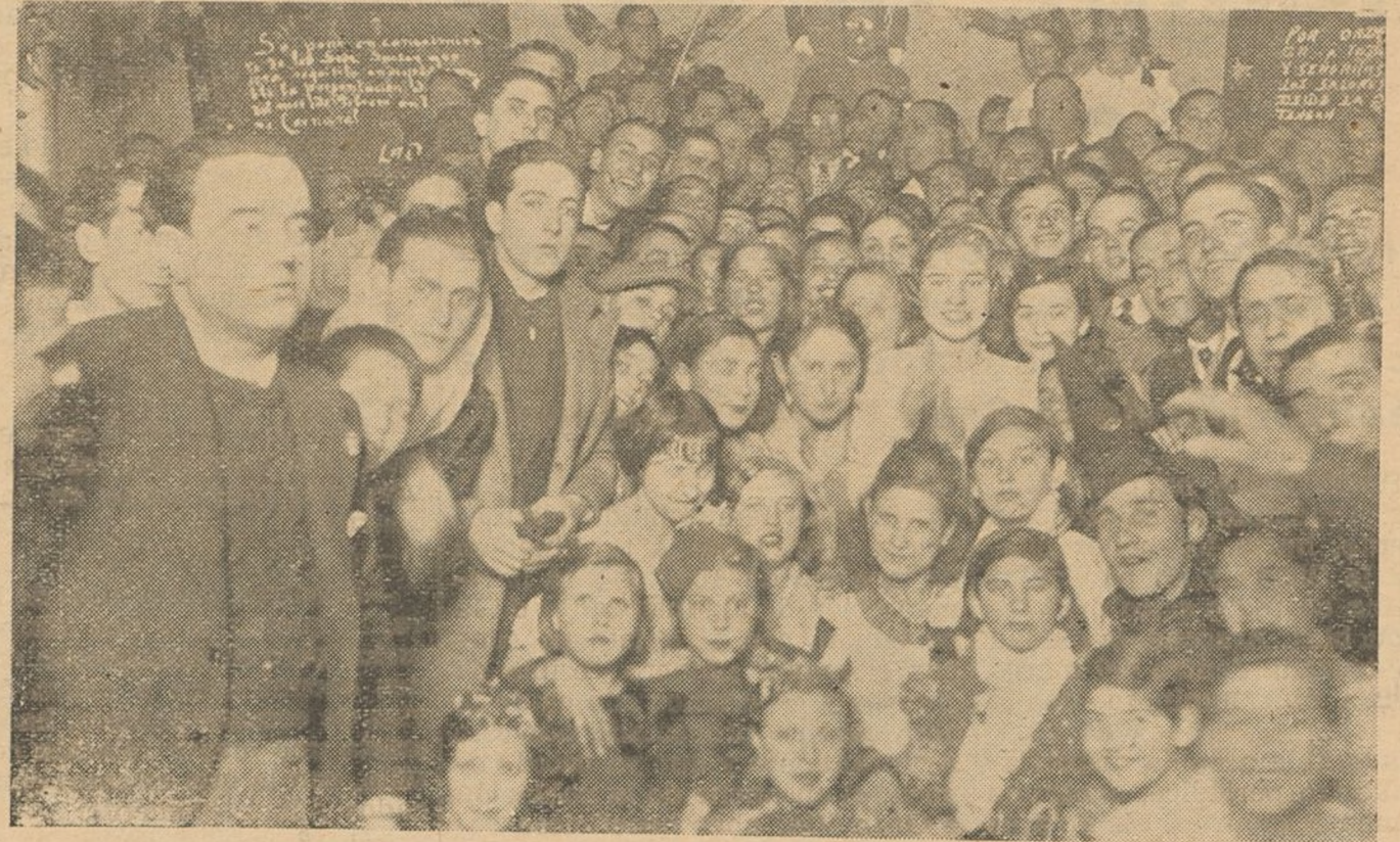
El Orfeón Onubense ha celebrado con gran animación sus bailes de Carnaval. Prueba de lo concurrida que se vió dicha Sociedad es esta fotografía.