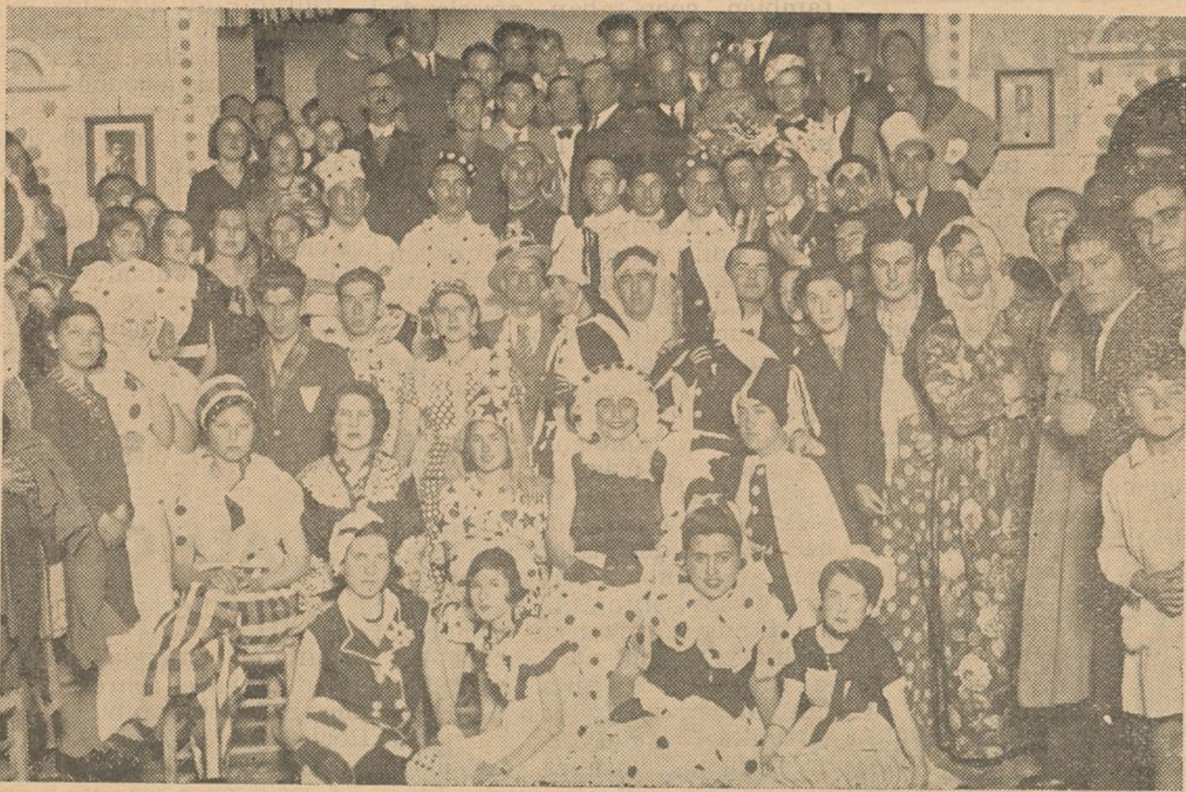
Grupo de asistentes al baile de «Blanco y Negro» celebrado por la Sociedad Benavente