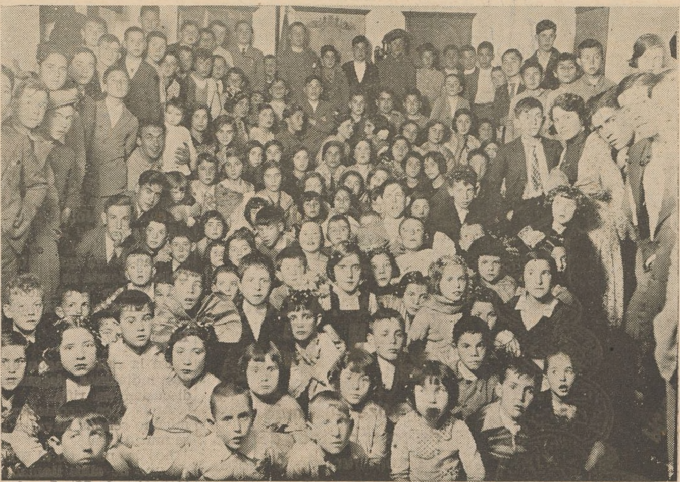
Grupos de niños que asistieron al Baile Infantil obsequiados por el señor alcalde y que se celebró en el Salón de actos del Ayuntamiento.

Nuestra felicitación a la Comisión y a prepararse para ir exornando el patio del Casino La Paz para el viernes del Rocio en que hacen noche en esta las Hermandades de nuestra Blanca Paloma.