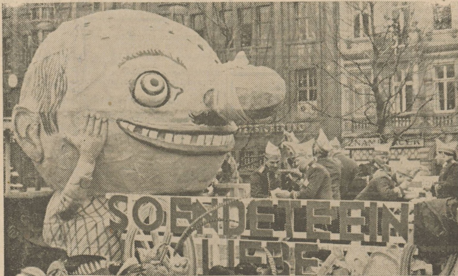
En Colonia, la clásica ciudad de los carnavales alemanes, se ha celebrado este con extraordinaria brillantez. Un aspecto del último día de Carnaval y una carroza humorística.