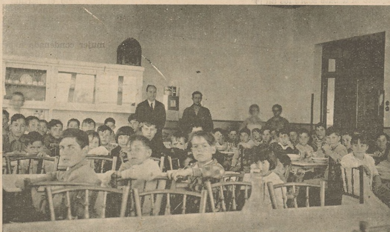
Aspecto del comedor de la Cantina Escolar, a la hora del almuerzo.

El jueves pasado desembarcó en Cheburgo el empresario taurino Domingo González "Dominguín". En unión de su señora que marchó a recibirle ha pasado unos días en París de donde ha marchado a Londres proponiéndose estar en Madrid a últimos de la presente semana.