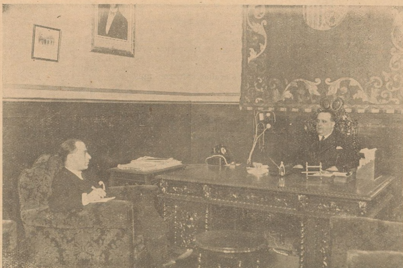
"Cires" celebra su interesante entrevista con el Gobernador Civil, Sr. Fernaud.

intereses encontrados... pero se llegó a una norma amparándose los intereses de todos. Este problema estiraba principalmente en que si en Huelva se consumiera el trigo que produce la provincia, no habría conflictos. Si en todos existiera patriotismo y no egoísmo comercial, sino el interés primordial de Huelva, seguramente no habría conflicto. Porque el trigo que se produce aquí, es suficiente para el consumo. Pero como las harinas que se importan en Huelva proceden de otras provincias, a mi juicio más del 60 por 100 del consumo, por ello se encuentran los graneros de trigo sin salida con perjuicio para la misma industria. —¿Qué conflictos hay pendientes en la actualidad? —El paro obrero, a lo que se atiende con todo interés. El gobierno procura satisfacer las peticiones que en Huelva se hacen y es de esperar que en breve se pongan obras en ejecución para remediar considerablemente el paro. Yo confío en que se obtendrá la subvención para caminos vecinales que tiene solicitada la Diputación Provincial. En Madrid, he trabajado estas cosas y el ministro de Obras Públicas me ha ofrecido complacerme. Con el estudio que se está haciendo acerca de la realización de obras en la provincia de Huelva, la solución del paro forzoso tendrá un pronto cauce exigiéndolo así los meses difíciles que tocan ahora, toda vez que después vienen las faenas de campo y pesca que aminorarán el conflicto. —¿Cuál es la manifestación