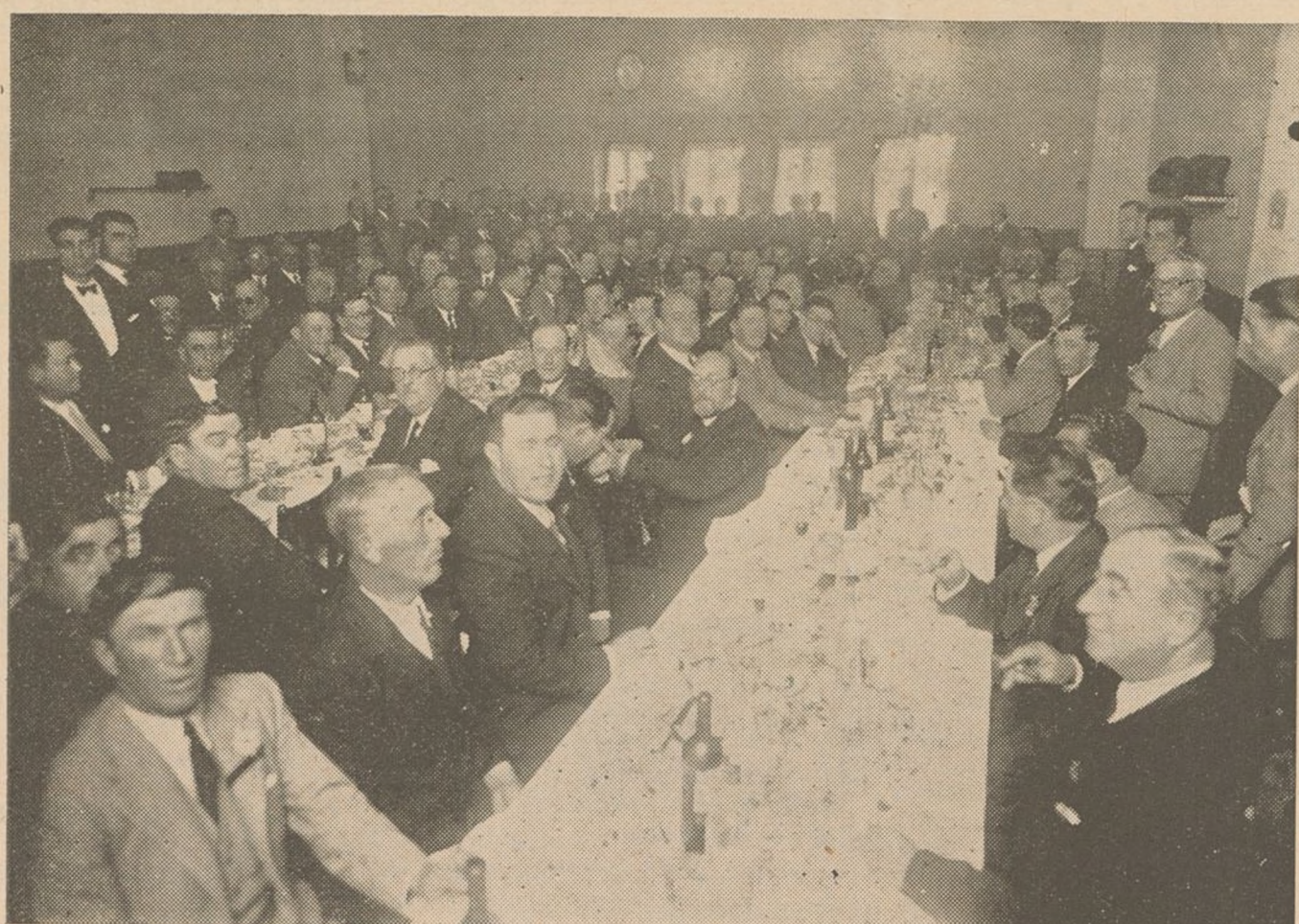
Un aspecto del banquete en el Casino Comercial.