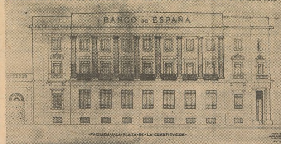
Fachada a la Plaza de la Constitución

mental que acusa la planta baja de oficinas con grandes huecos para proporcionar ventilación y luz abundante.