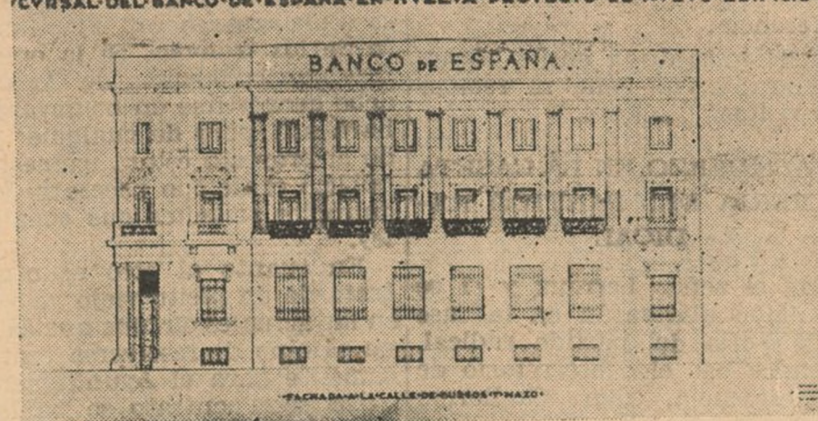
Fachada a la calle de Burgos y Mazo

de columnas adosadas en las paredes con la inscripción "Banco de España".