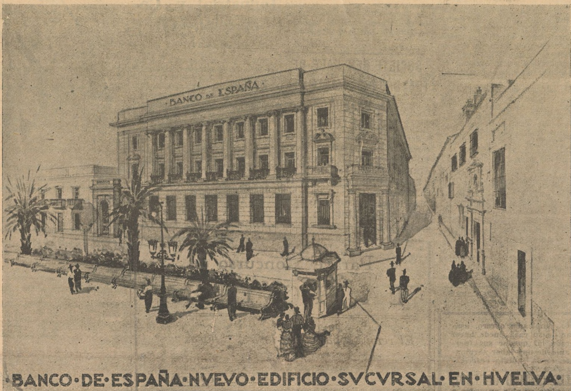
BANCO DE ESPAÑA NUEVO EDIFICIO SUCURSAL EN HUELVA