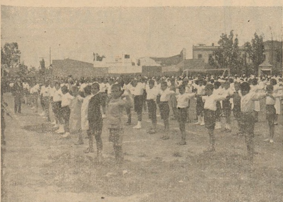
Grupos de niños haciendo ejercicios gimnásticos en el Velódromo