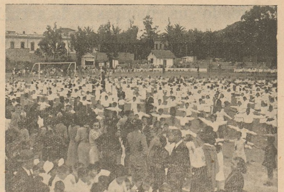
Grupos de niños haciendo ejercicios gimnásticos en el Velódromo