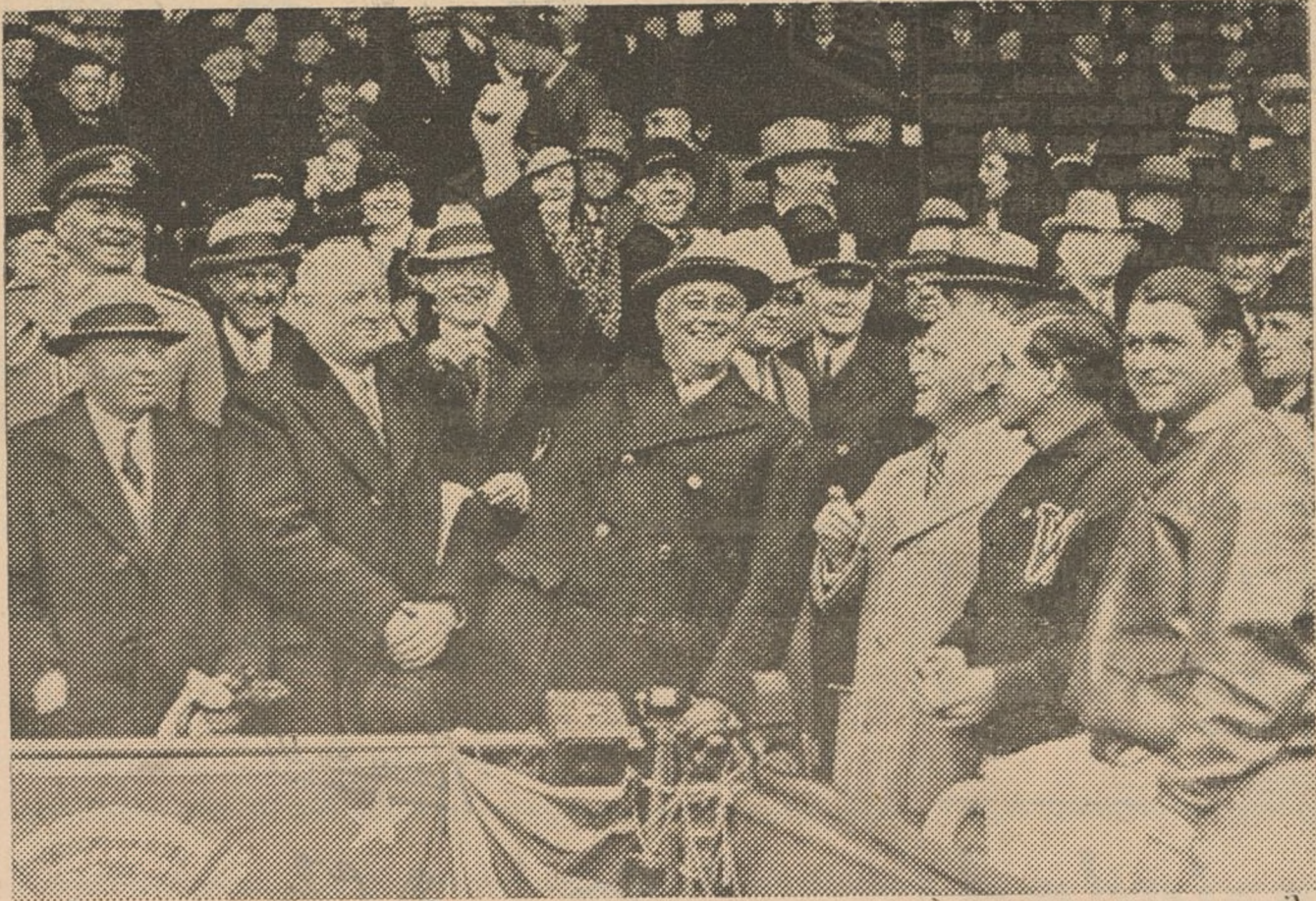
El presidente de los Estados Unidos Mr. Franklin Roosevelt ha asistido a un match de base-ball "Washington-Philadelphia" que tuvo lugar recientemente en Washington.-El presidente Roosevelt lanzando la primera pelota del partido.