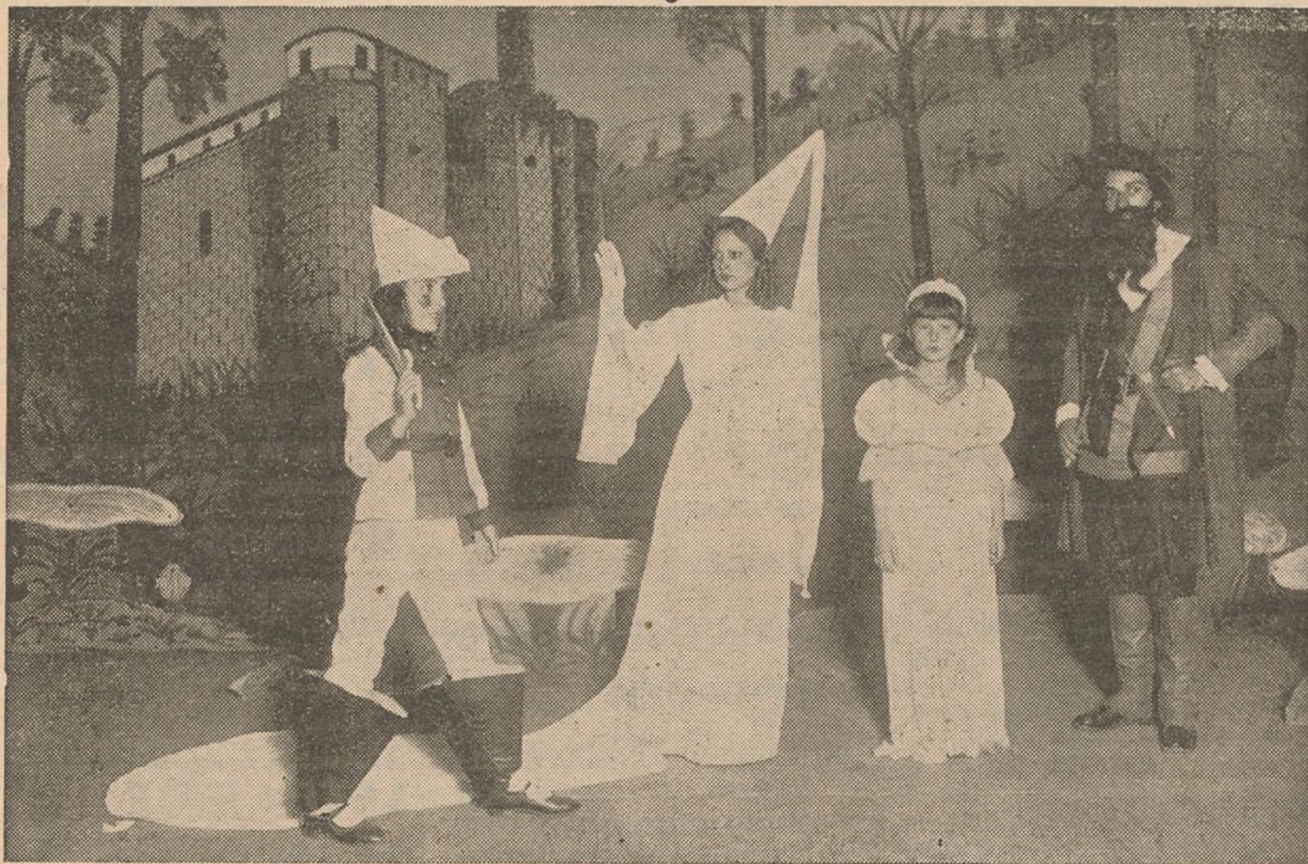
Una escena de la obra "Por el mundo de ellos". El Hada habla con Pipó. En la lejanía se recorta en tonos grises la silueta del castillo mágico

vada, plena de sabor infantil unas veces, otras con una filosofía apropiada para mentes que empiezan a comprender, a vislumbrar.