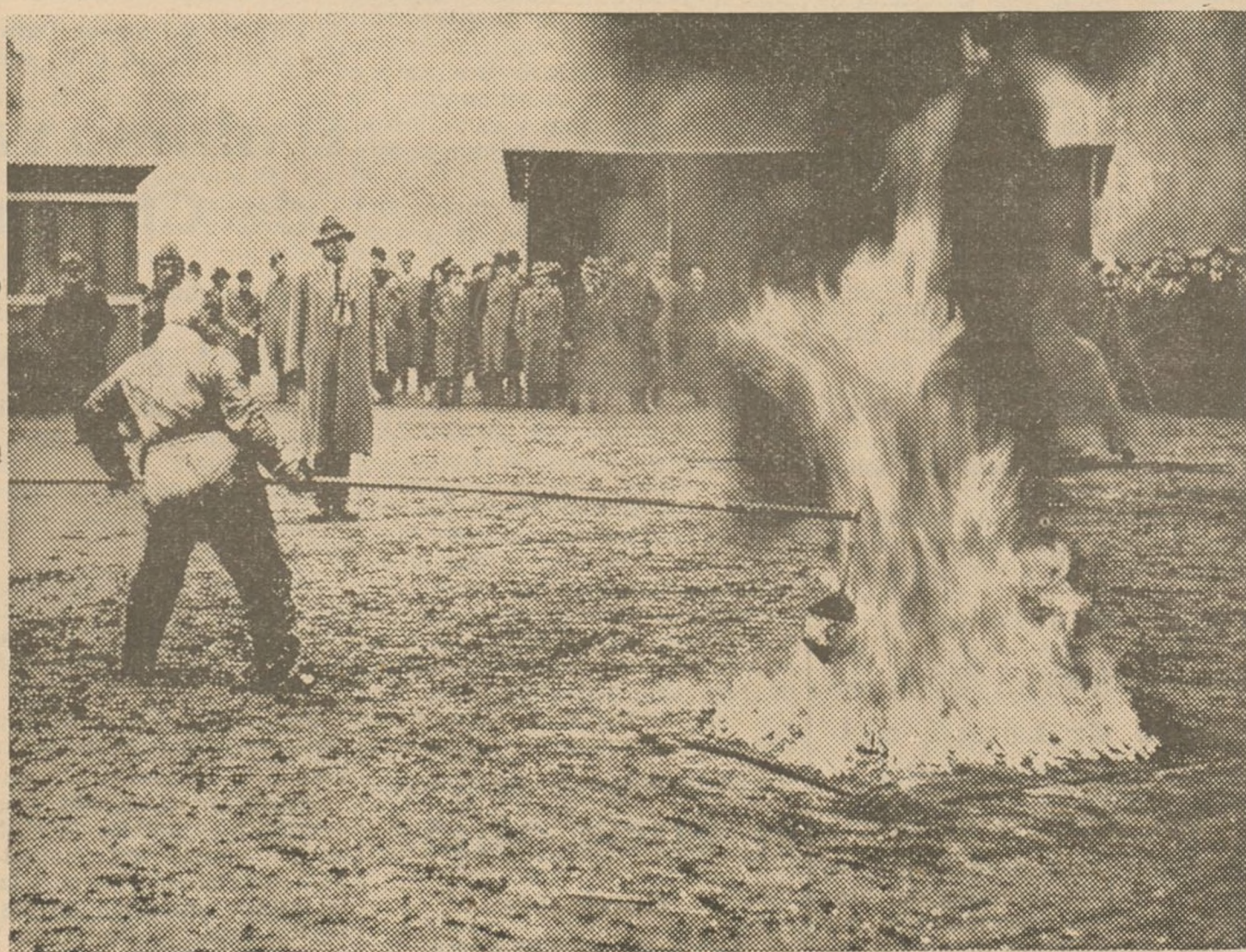
En Roma han sido probadas oficialmente, unas nuevas bombas a paga-fuegos. El inventor apagando una alfombra ardiendo con la bomba de su invención.