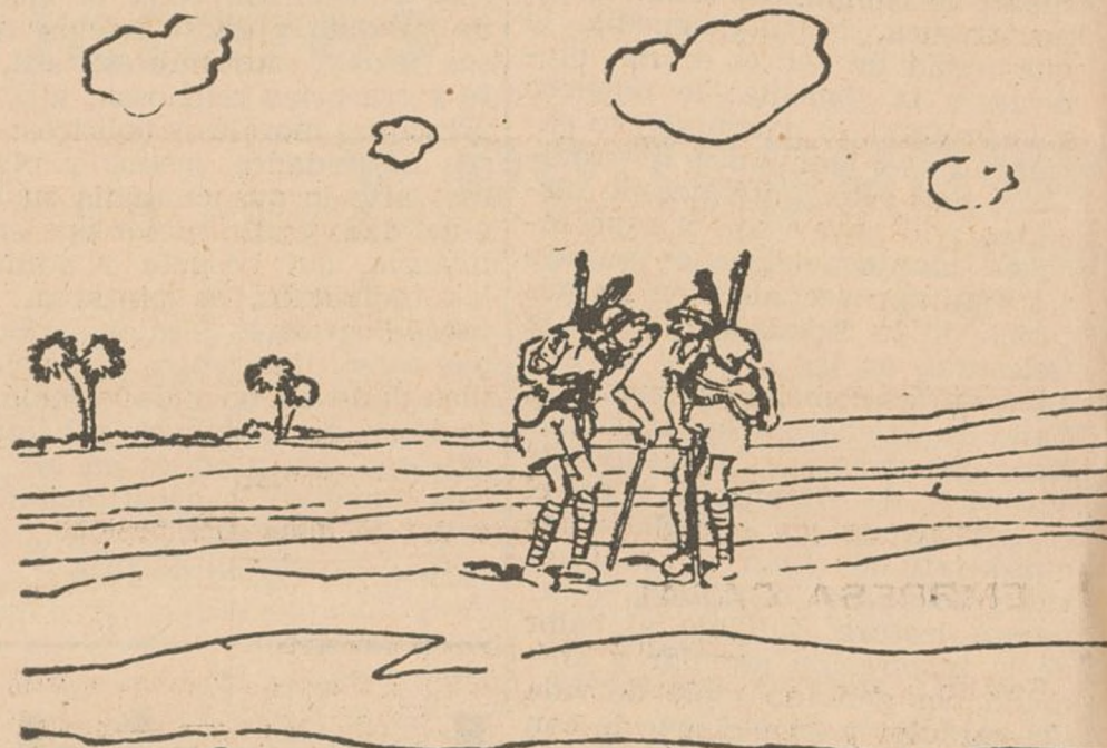
--¡Pero habla más alto que no te oigo! --Es que no quiero que algui en se entere de lo que hablamos. (De "Noir et Blanc", de París.)