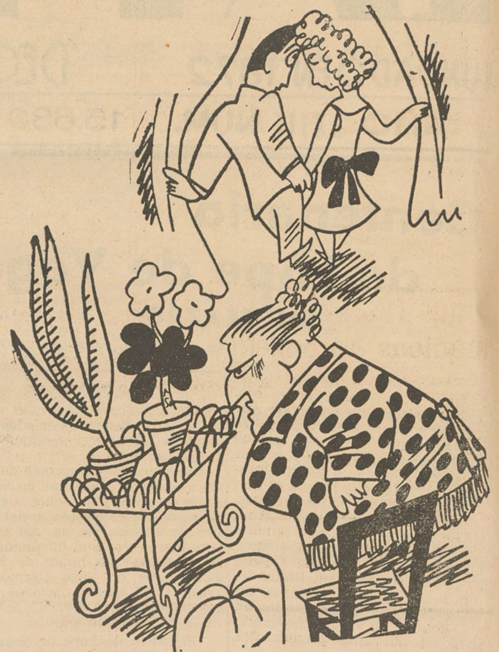
--¡Vándalos! ¿Pues no han grabado sus iniciales en el talle del geranio? (De "Gouta a Vous", de París)