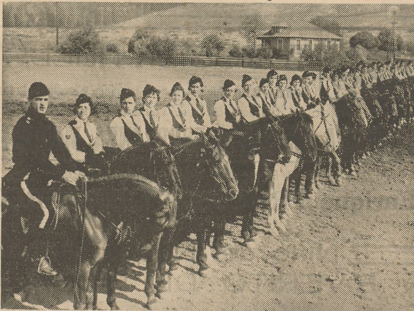
En la mujer alemana amiga de todos los deportes, ha renacido ahora la afición a la equitación. Ved aquí a este grupo de bellas tirolesas preparándose a hacer ejercicios dirigidas por un competente profesor