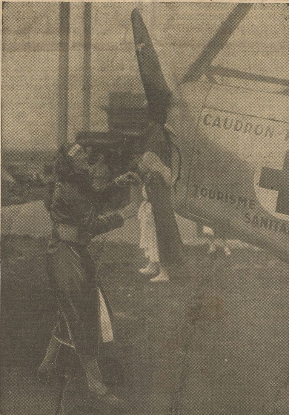
El cuerpo francés de enfermeras cuenta en la actualidad con señoritas pilotos que pueden ellas mismas conducir aviones en caso de que sobrevenga un accidente al aviador. En la "foto" vemos a una de ellas poniendo en marcha un motor