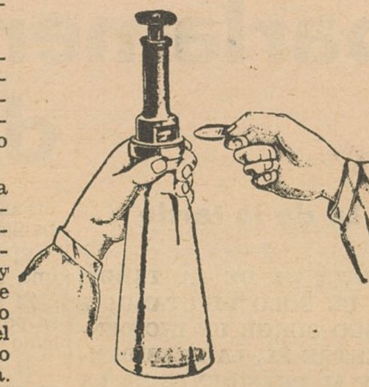
Precintado de botellas

tura y únicamente a la salida, al mazzarse las dos partes, es cuando se obtiene el grado deseado. Es necesario, al contrario, que el calor sea lento y que la leche