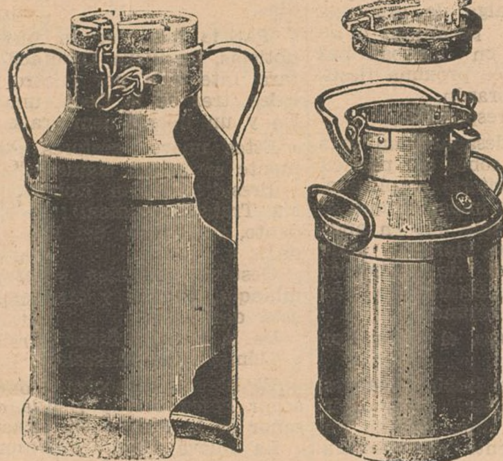
Envases para el transporte de leche.

La leche resulta de este modo reténida y batida en la periferia, con una temperatura superior a la fijada; el centro por el contrario, permanece a menor tempera-