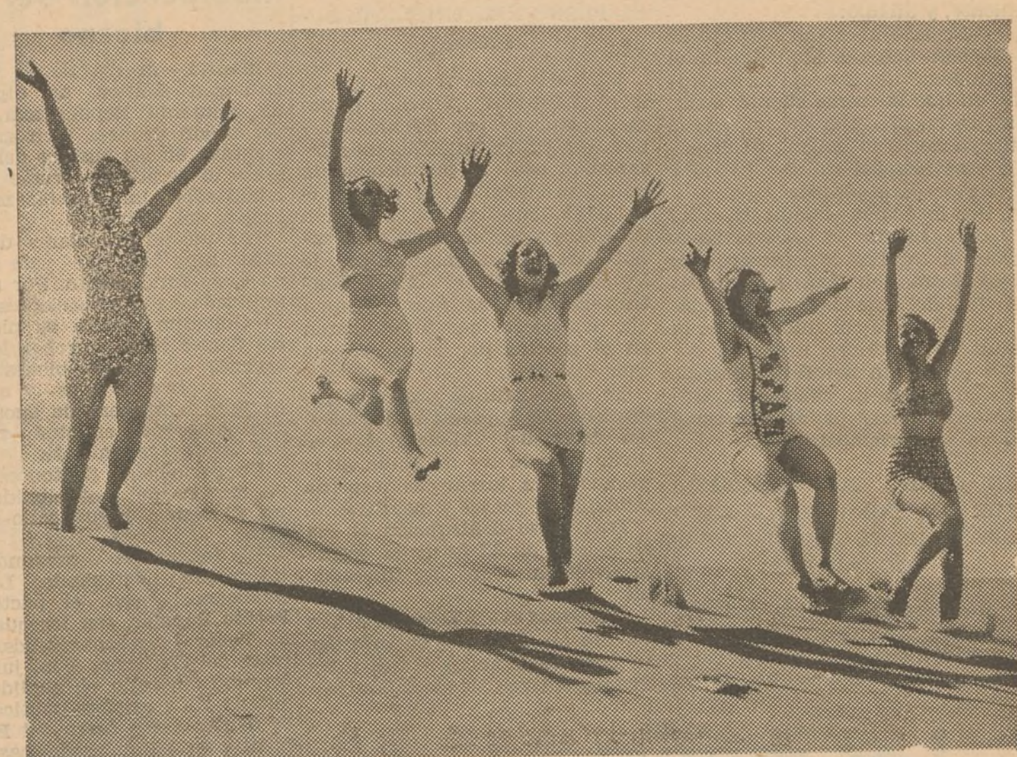
Ya las playas reciben gozosas con leves crujidos de arenas y suave murmullo de olas, a las primeras bañistas. Y ellas rien, y saltan alborozadas ante la naturaleza libre y salvaje frente al mar. (Express-Foto).