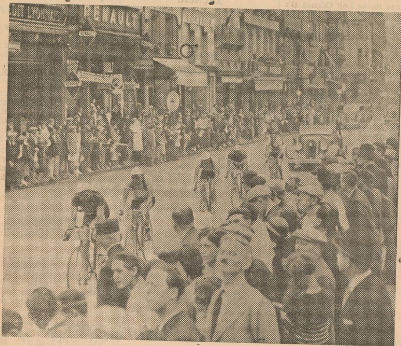
El paso de los corredores por Beauvais en la etapa París-Lille, que fué ganada por el suizo Egli.