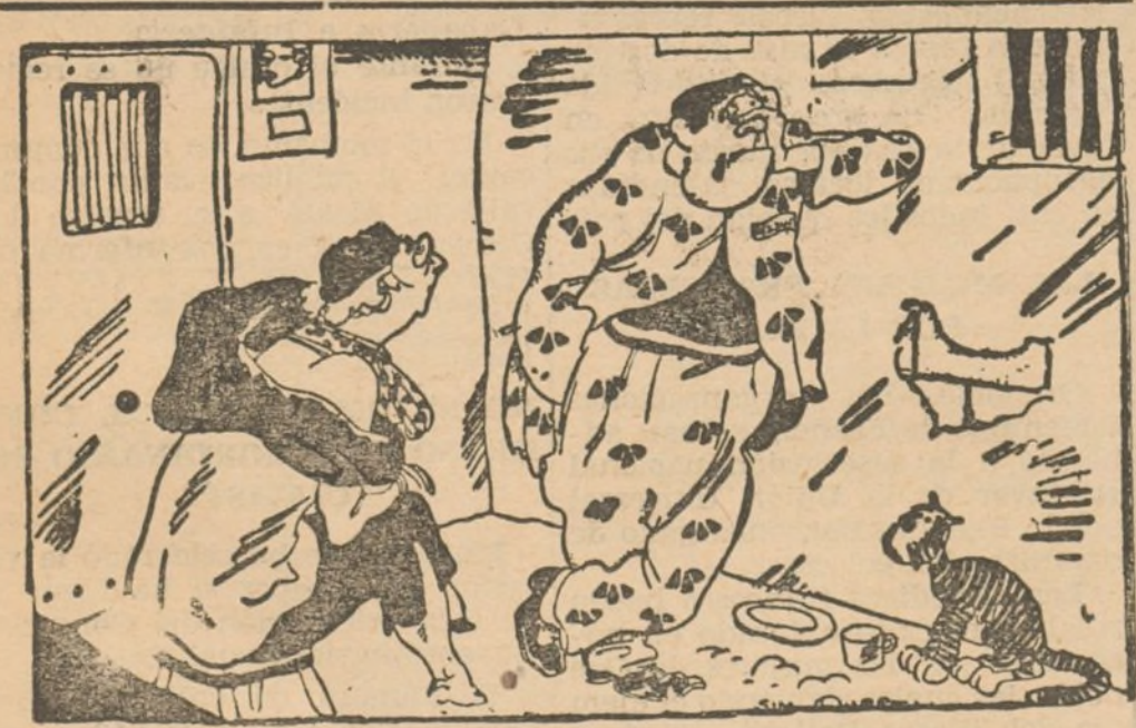
LA VISITADORA DEL PRESO

--¿Y no viene a verlo ninguna persona de su familia? --No, señora; no los dejan salir de sus celdas. (De "Smith's Weekly", de Sidney)