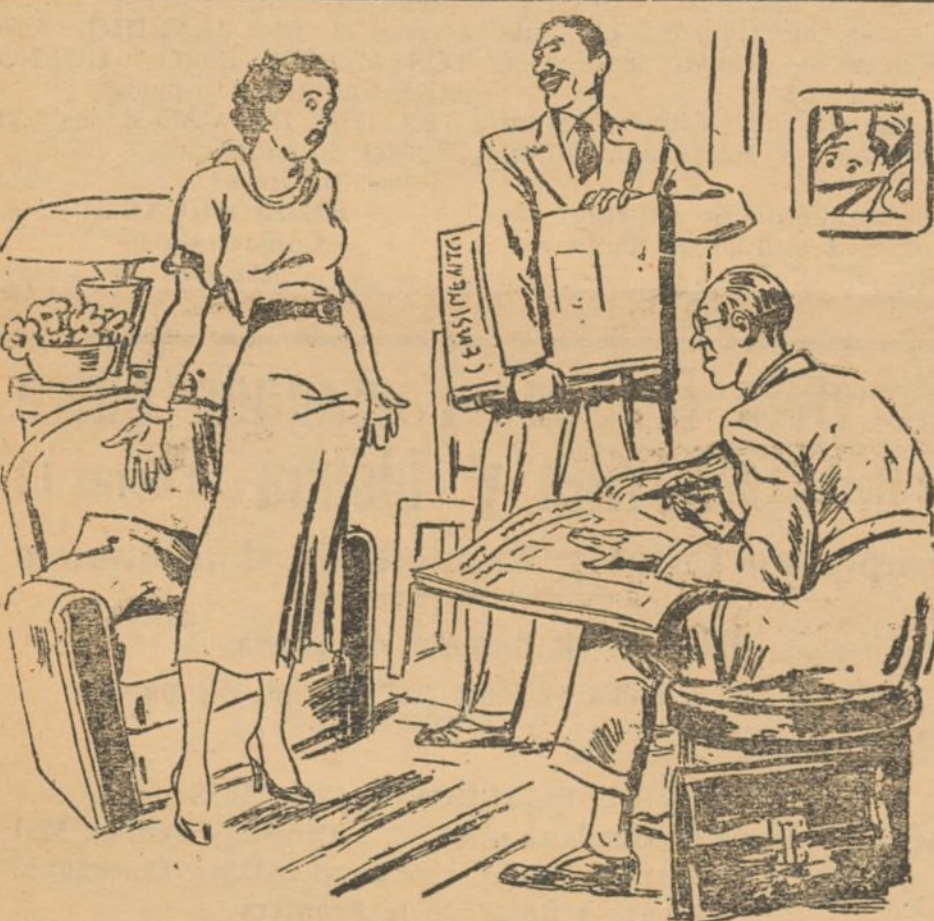
RECTIFICACION DEL CENSO

--¿Su edad, señora? --¿Pero no le dije ya, hace cinco años, que tengo treinta? (De "Il Travano", de Roma)