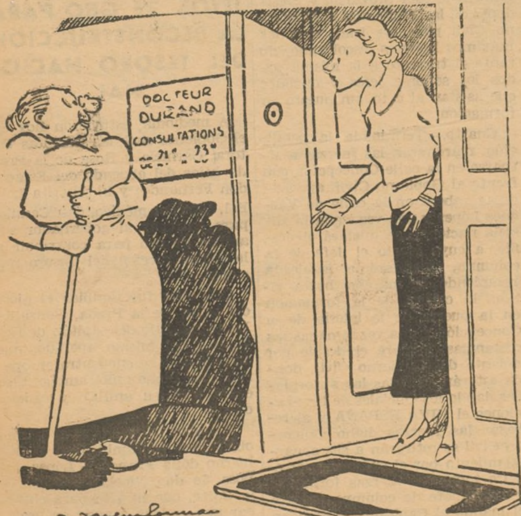
EL JOVEN DOCTOR

--¿Y por qué ha puesto el doctor de nueve a once de la noche las horas de consulta?