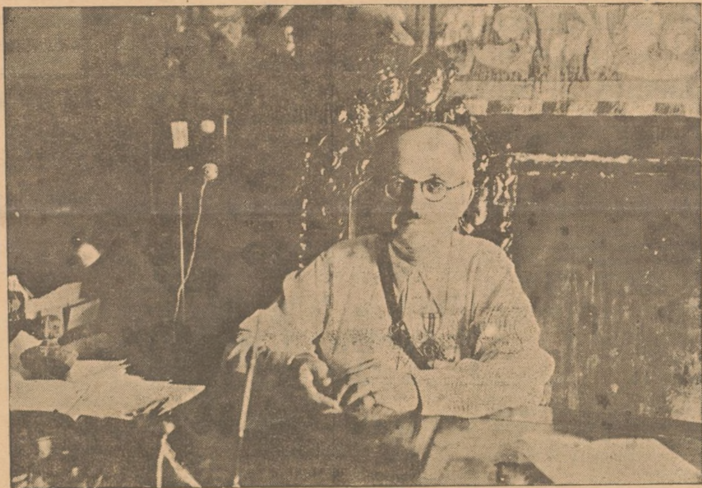
VALOR, HONOR Y PATRIOTISMO CONSTITUYEN LA TRILOGIA DEL GOBERNADOR CIVIL Y MILITAR DE HUELVA