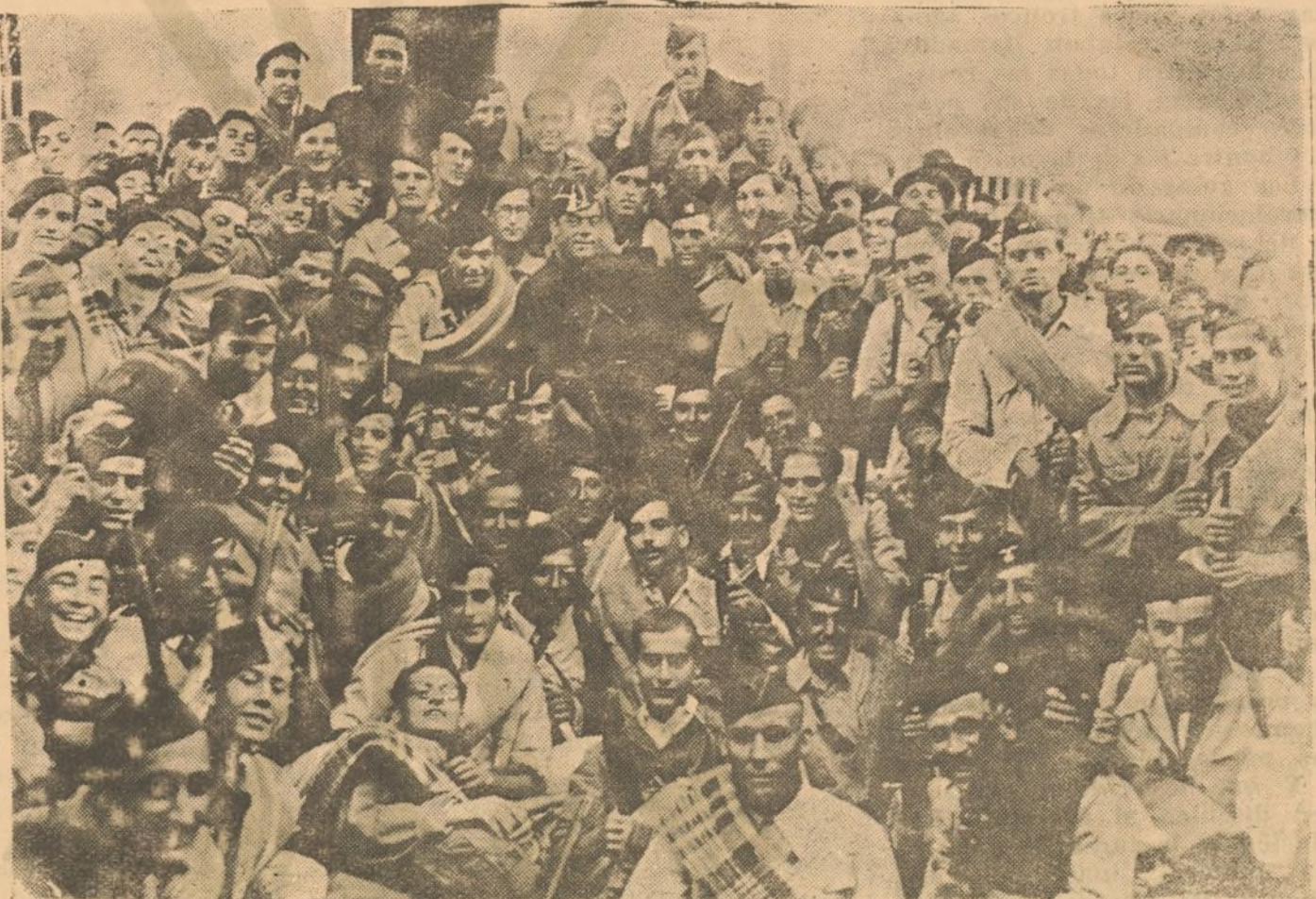
Altivez en el rostro grandeza en el alma.

¡Primera Bandera de Falange de Huelva! ¡Volverá victoriosa y con orgullo de haber contribuido a guiar a España por el camino que ha emprendido; sendero de luz y de verdad para llegar a una meta de paz y de armonía. No hay fuerza humana que la pueda hacer retroceder, porque la voluntad de Dios tiene que estar al lado vuestro que vais decididos, porque España llamó "y todos, todos fueron". ¡Camaradas de la Primera Bandera de Falange! ¡Éxito en la empre-