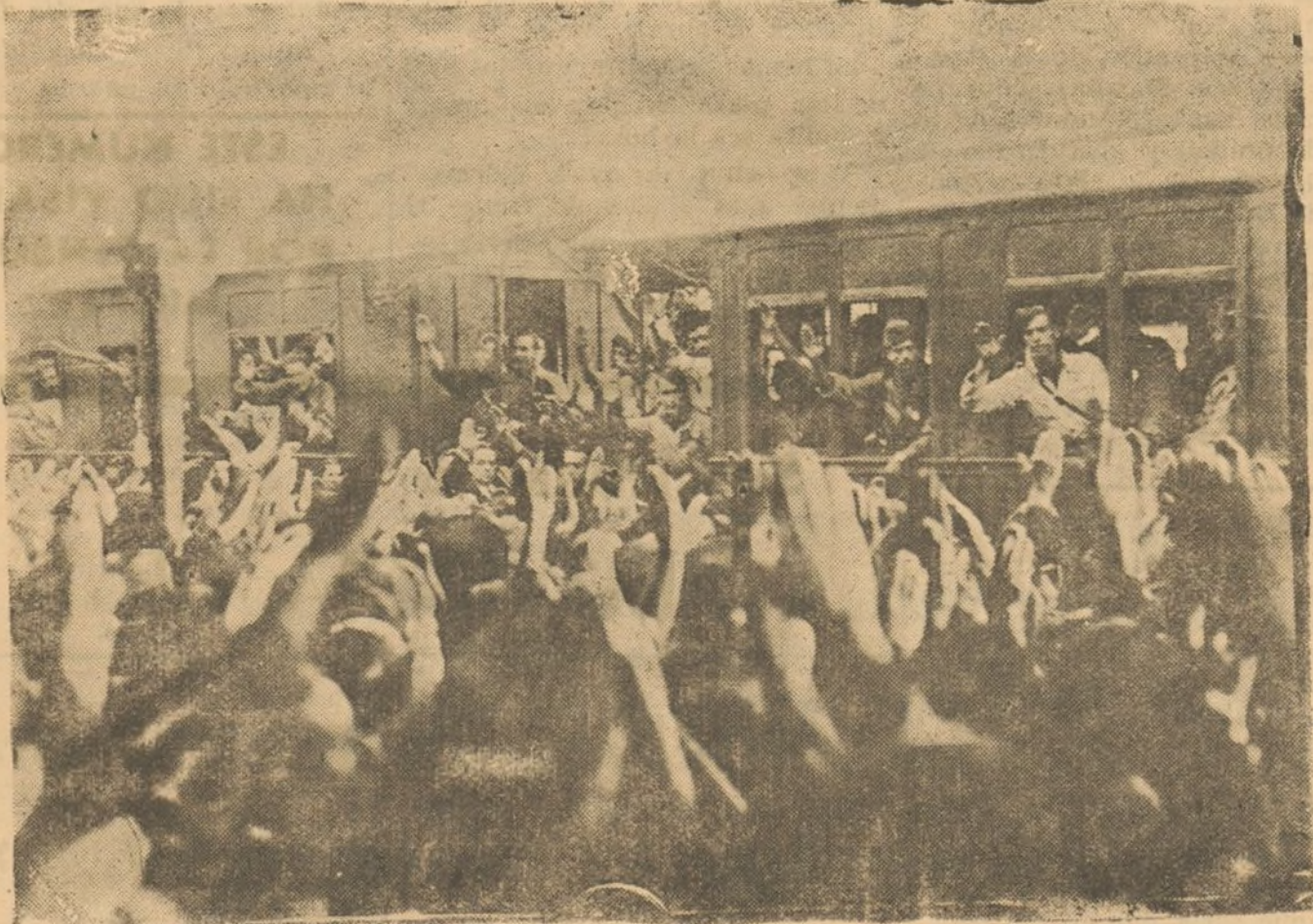
Toda España saluda al estilo falangista