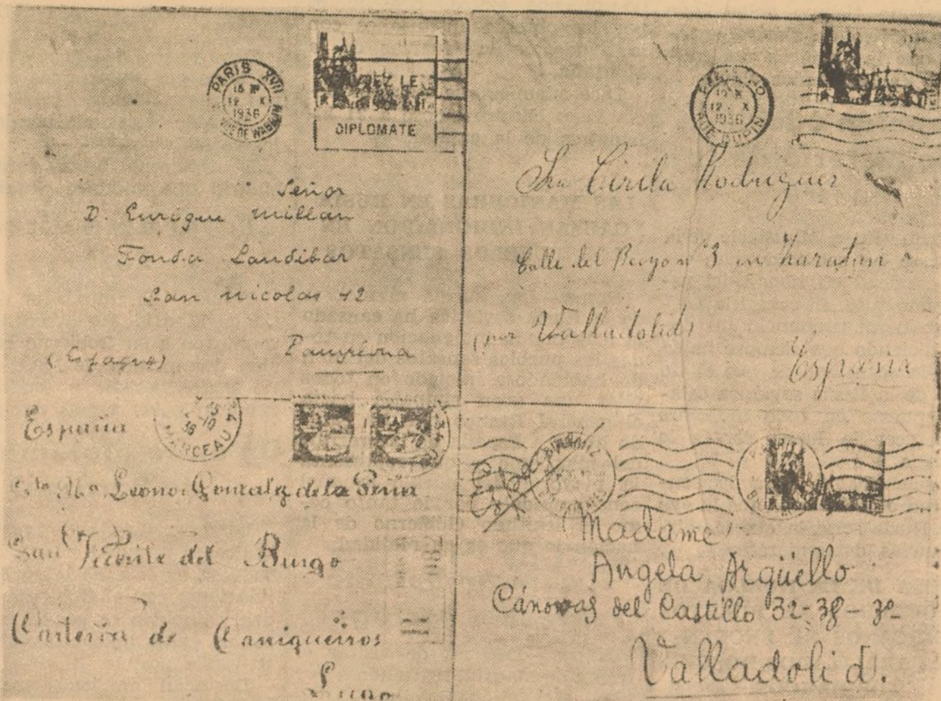
Facsimil de sobres de algunas de las cartas recogidas a bordo del vapor rojo "Galerna."

El día 15 del corriente, varios barcos artillados al servicio del Gobierno de Burgos, apresaron al barco "Galerna", que desde hace tiempo venía dedicado por los rojos al tráfico entre Francia y Vizcaya. El "Galerna" procedía del puerto de Bayona y se dirigía al de Bilbao.