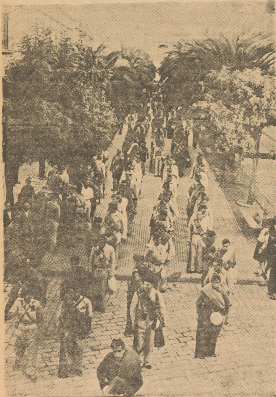
En el Paseo de Santa Fe, la Bandera de F. E. «Los Pinzones» espera firme la orden de marchar.

De la marcha al frente de la Bandera «Los Pinzones»