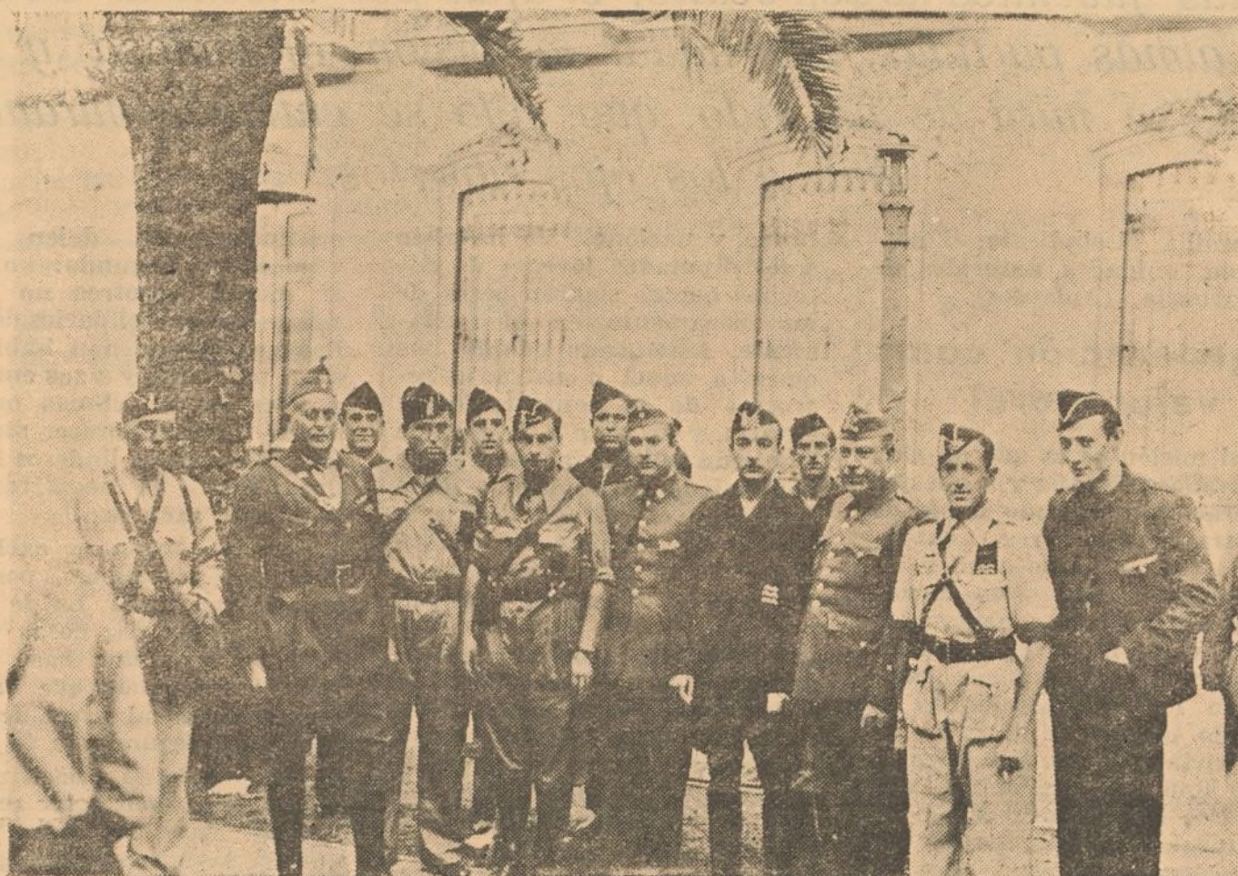
Oficiales del Ejército y Jefes de la Bandera de F. E. «Los Pinzones» que salió el domingo para el frente, en unión de otros camaradas que fueron a despedirlos.