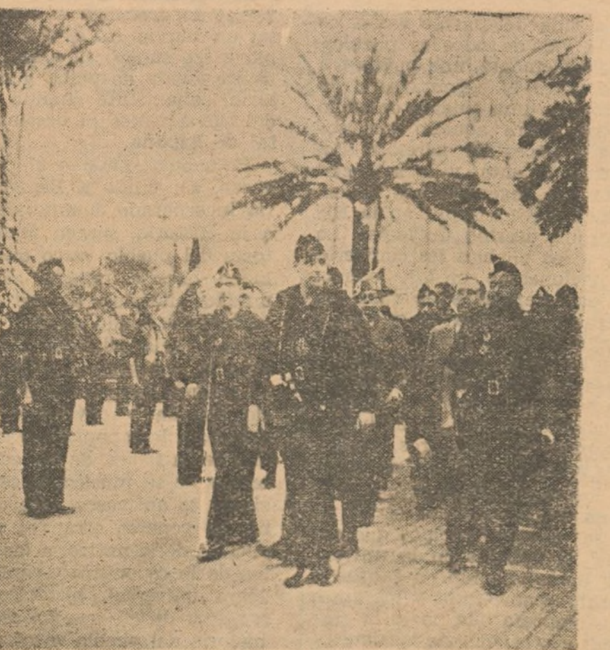
Sancho Dávila pasa revista a las centurias de Falange en Huelva.