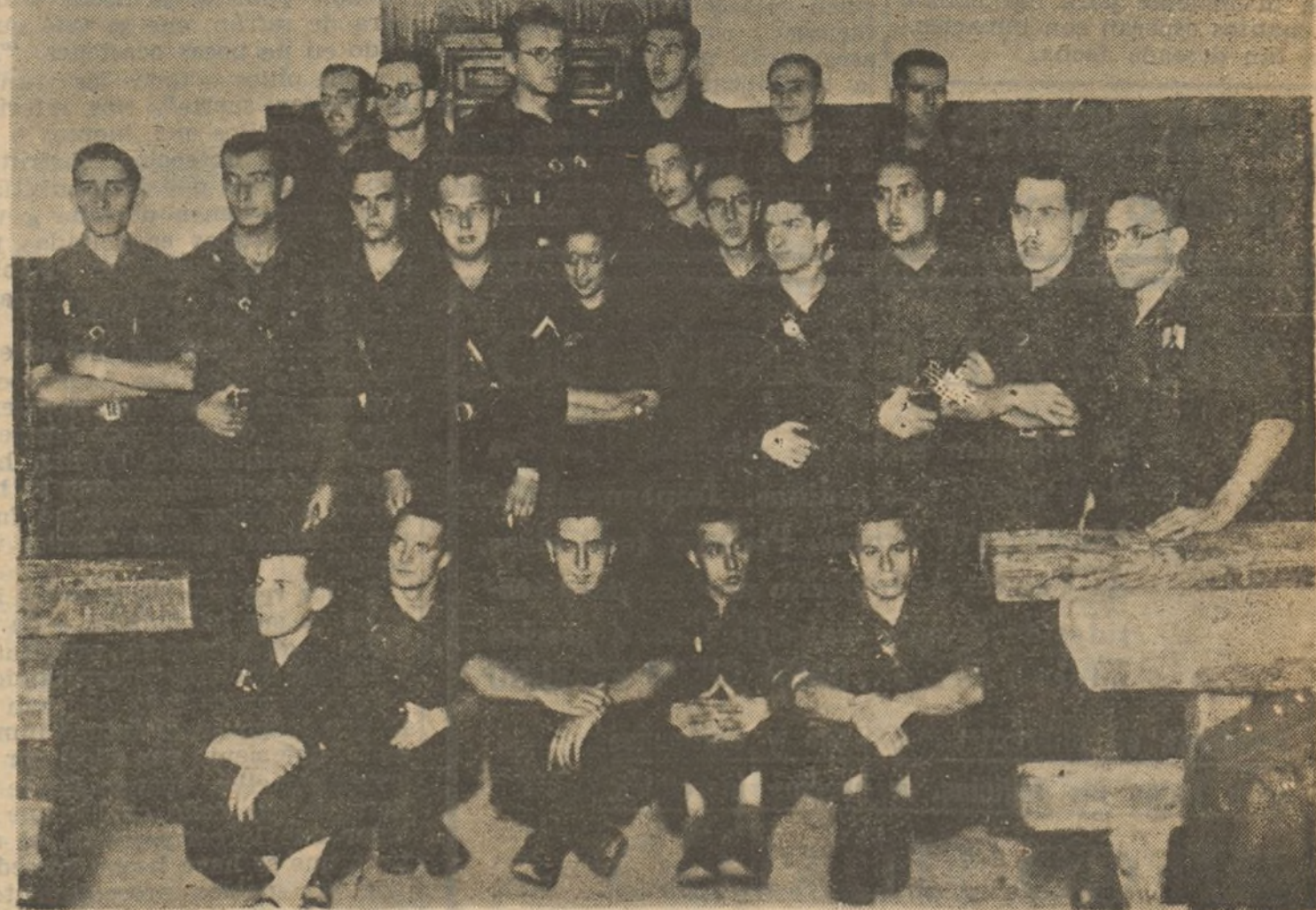
Miembros del III Consejo Nacional, del S. E. U., celebrado en Salamanca, reunidos en la Catedral de Fray Luis de León, de dicha Universidad, donde se celebraron las sesiones.