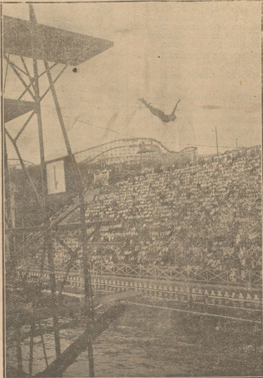
En la piscina de la Exposición de Barcelona se ha celebrado recientemente un concurso de varias pruebas de natación. Ved aquí un formidable salto dado por uno de los participantes.