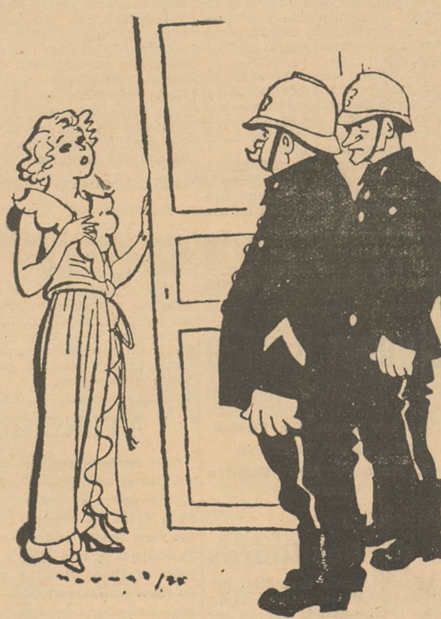
--¿Es aquí de donde han llamado al servicio de incendios? --Sí, señores... ¿No les parece que huele algo a quemado? (De "Ric et Rac", de París.)