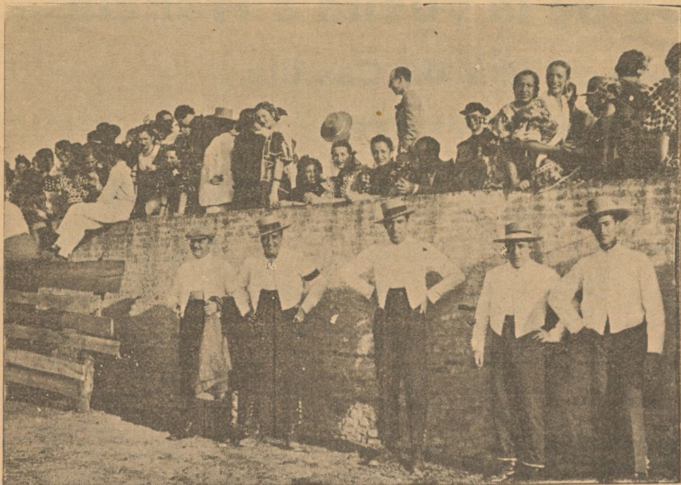
Algunos de los concurrentes que asistieron a la fiesta.

Y en un ambiente de simpática alegría, transcurrieron las