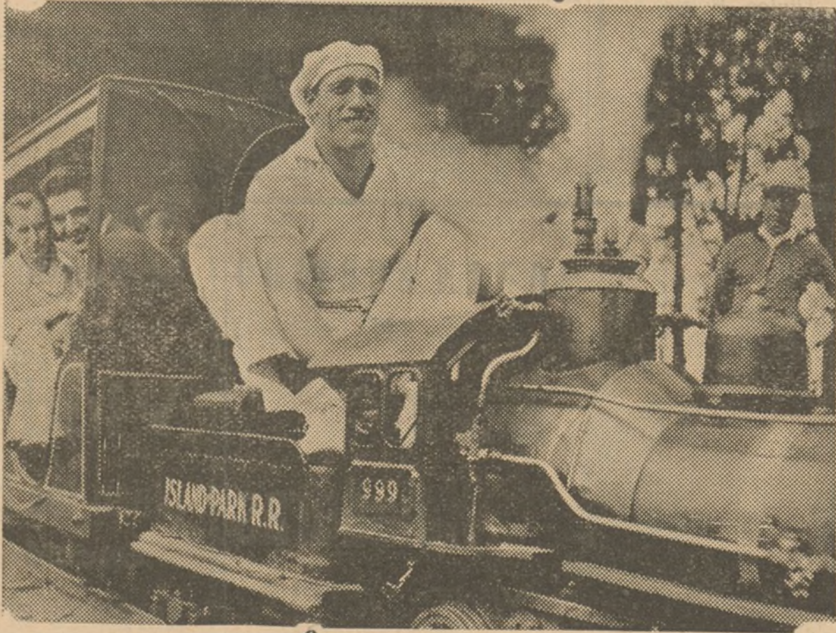
Los concurrentes a la feria de Owasco Lake (Estados Unidos) que actualmente se celebra, han podido ver hace unos días como el gigante boxeador Primo Carnera se entretiene como un niño con un juguete maniobrando una locomotora en miniatura del ferrocarril diminuto que se encuentra instalado en dicha feria.