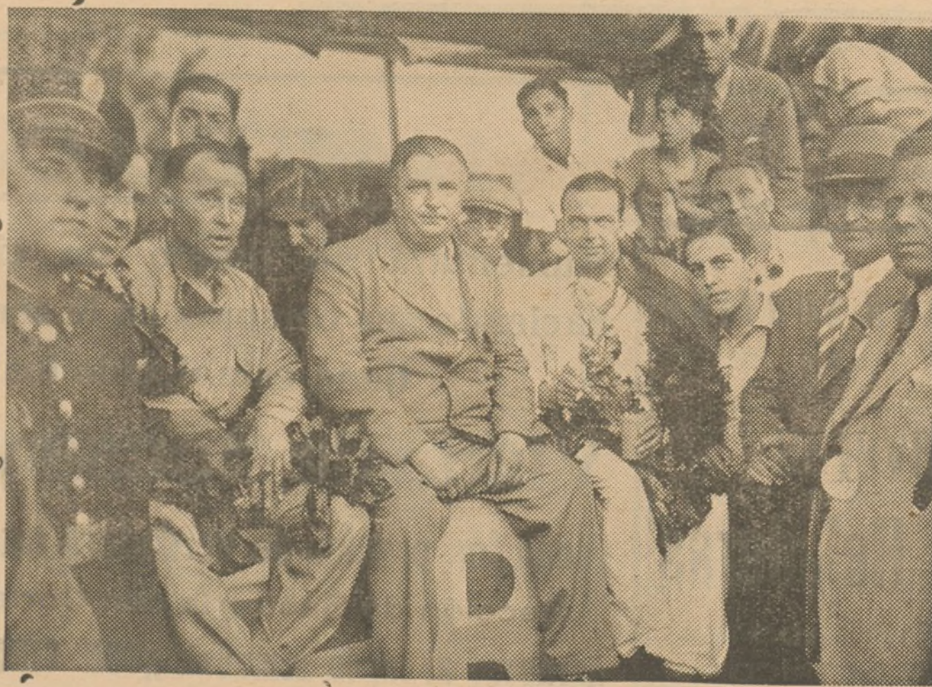
En el circuito Montjuich (Barcelona), ha tenido lugar la gran carrera internacional del automóvil. Fagioli y Caracciola sobre «Mercedes-Benz» y Nuvolari sobre «Alfa-Romeo», fueron los vencedores. En la «foto» vemos a Fagioli y Caracciola con el representante de la Casa «Mercedes-Benz» después del triunfo.