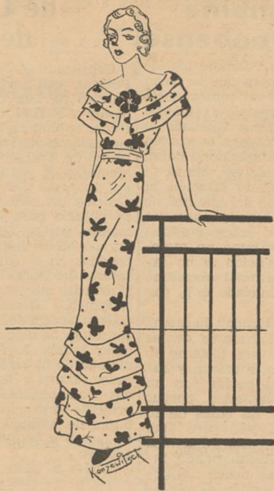
Vestido para jovencita, muy ligero, a propósito para baile y para la temporada actual.

Para lavar la lana negra, se emplea a veces la hiel de buey, que también puede servir para la lana verde.