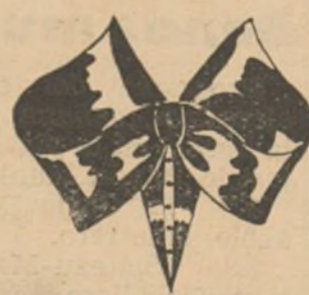
Original lazo superpuesto en tela de seda que puede aplicarse a diferentes vestidos de tonos claros y escote apropiado

Cuando los objetos de hoja de lata han experimentado varias veces la acción del calor, pierden su brillo natural y adquieren una entonación más o menos negra. Se pueden limpiar con un trapo empapado en aceite y ceniza formando una pasta semifluida. Algunas veces se añaden polvo de carbón a la pasta. Después se frota con un trapo de lana.