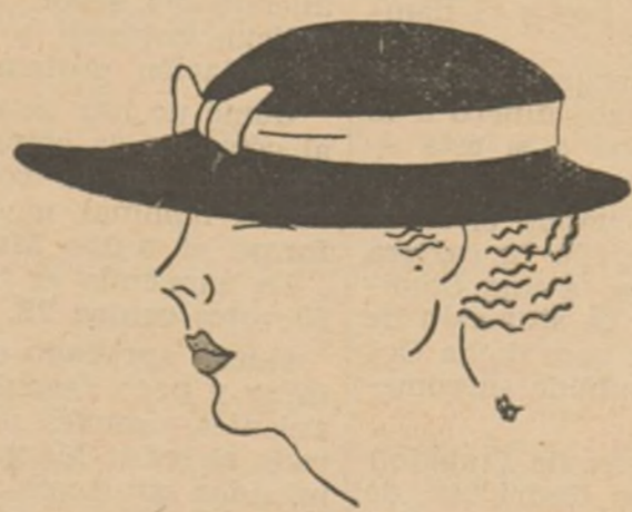
Elegante sombrero de paja negra adornado por una ancha cinta de seda blanca, modelo reciente.

El baño matinal no tiene más objeto que estimular la circulación de la sangre y activar las funciones de todo el organismo, adormecidas por el descanso nocturno.