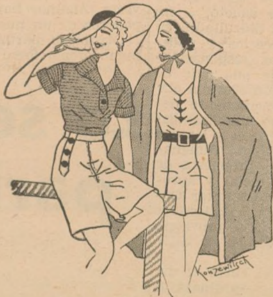
Elegantes vestidos de playa; uno "maillot" con capa grande, color amarillo; el otro de tipo sport a base de camiseta de punto y pantalón corto y ancho en tela clara.

Prepárese en un gran vaso: 1/3 de hielo molido. 50 gramos de fruta. Aparte, póngase en la coctelera unos pedacitos de hielo. 1/3 de limón exprimido. 1 cucharadita de azúcar. 6 gotas de Curacao Bardinet. 1 copa de vino de Burdeos. Agítese bien y se pasa al vaso añes preparado, con una rama de naranja. En una copa: 1/3 de hielo molido. 1/2 copa de Curacao Bardinet. 1/2 copa de menta verde. Sirvase con unas pajás.