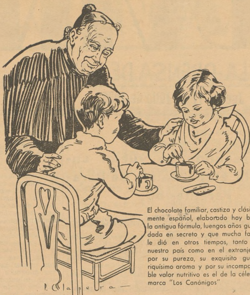
"Una jicara de chocolate 'Los Canónigos' es otra de las delicias de España."

España, muestra gran cantidad de casos de rabia en sus estadísticas —es preciso hacer cumplir energicamente la ley de epizootias— Inglaterra, Estados Unidos así como Suiza presentan orosillos las suyas: tal vez la carencia de rabia sea uno de los principales exponentes de la cultura de un pueblo.