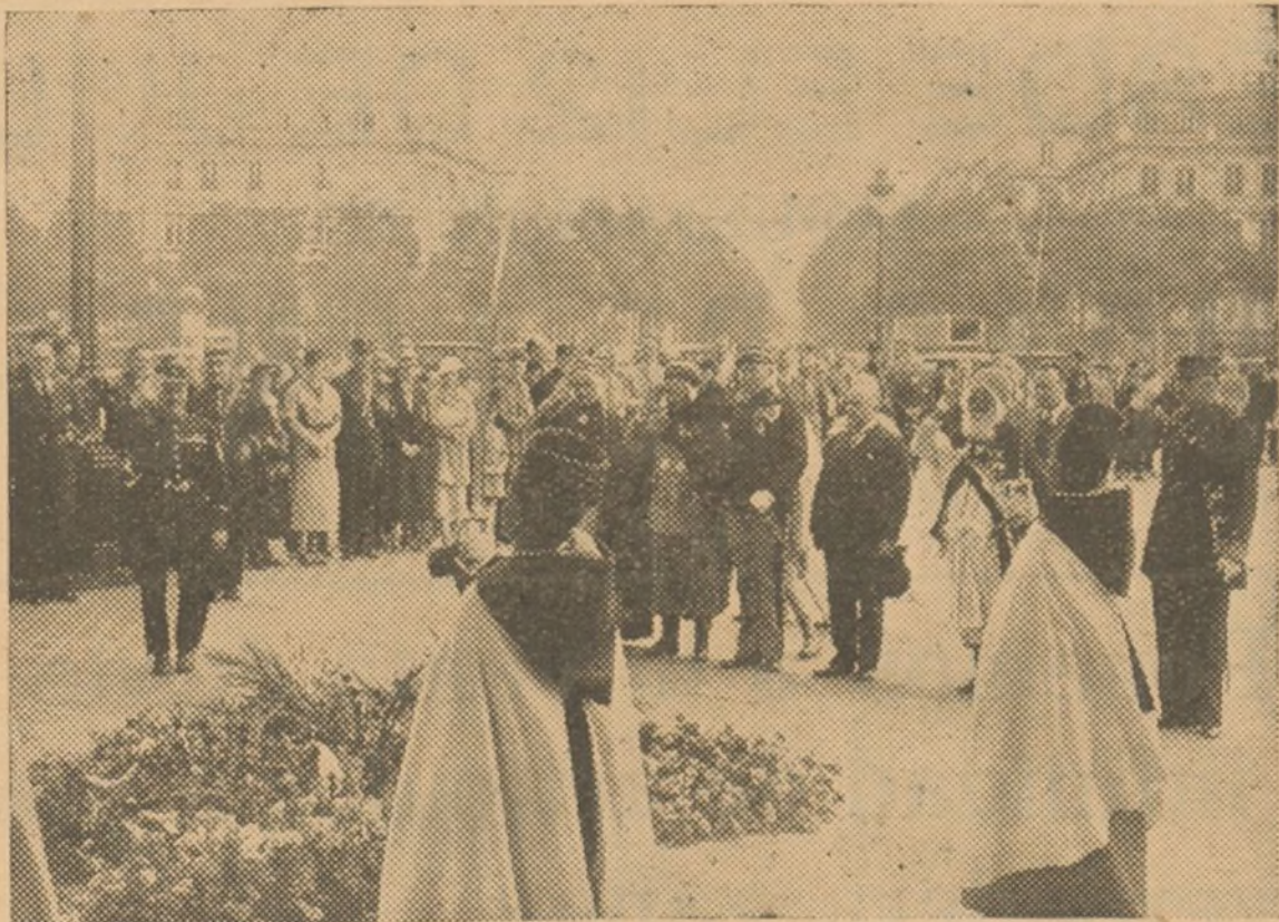
La delegación de medallas militares del Yser enviada por el gobernador general de Algeria a Bruselas con motivo de la inauguración del pabellón de Francia de Ultramar en la Exposición de la capital de Bélgica de paso a París, depositó un ramo de flores sobre la tumba del soldado desconocido.