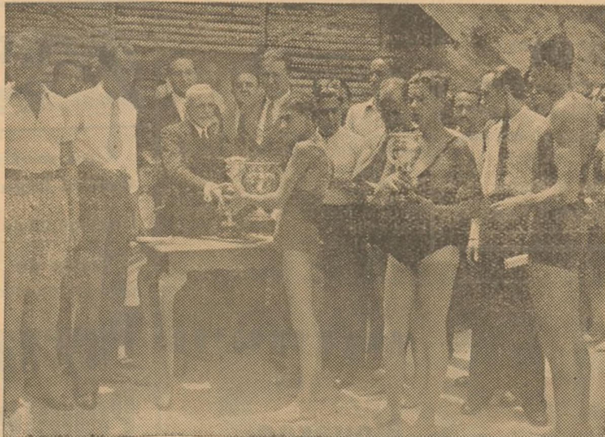
Presenciado por numeroso público se ha celebrado la tercera edición de la vuelta al lago de la Casa de Campo en Madrid organizada por el Canoe Club Madrileño. Entrega de los premios a los vencedores.