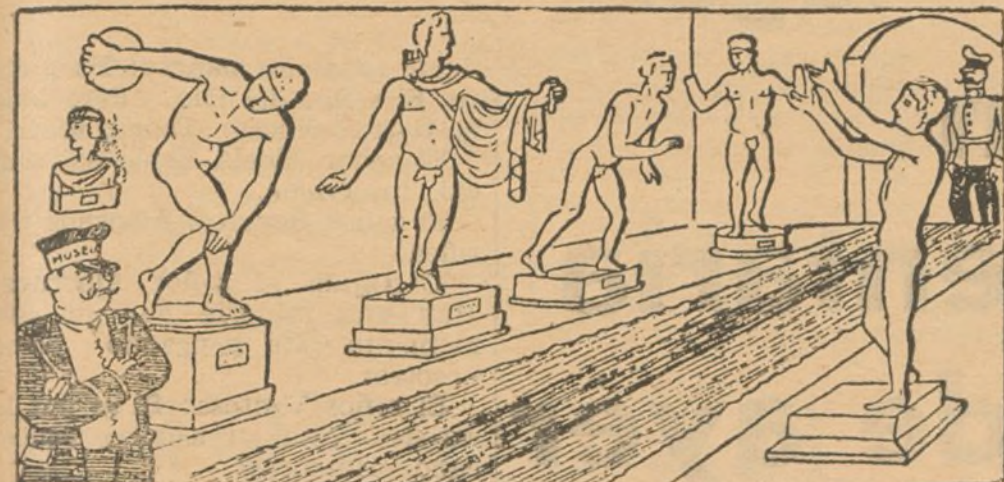
I EL GENERAL VISITA EL MUSEO