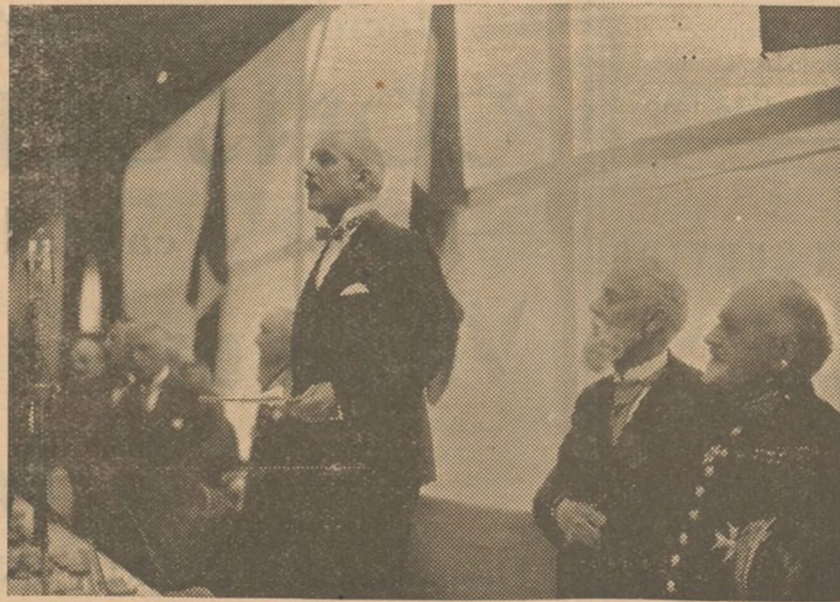
Uno de estos últimos días ha tenido lugar en Saint Nazaire, la botadura del crucero «Marsellaise», en presencia de M. Francisco Piétri, ministro de Marina de la vecina República Francesa. En la "foto", durante la ceremonia, M. Piétri pronunciando un discurso