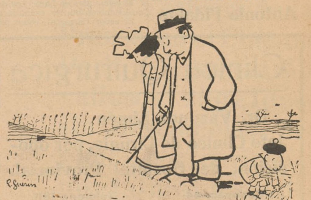
--¡Mira qué trigo más pequeñito! --Sí; es el que se emplea para hacer los panecillos.