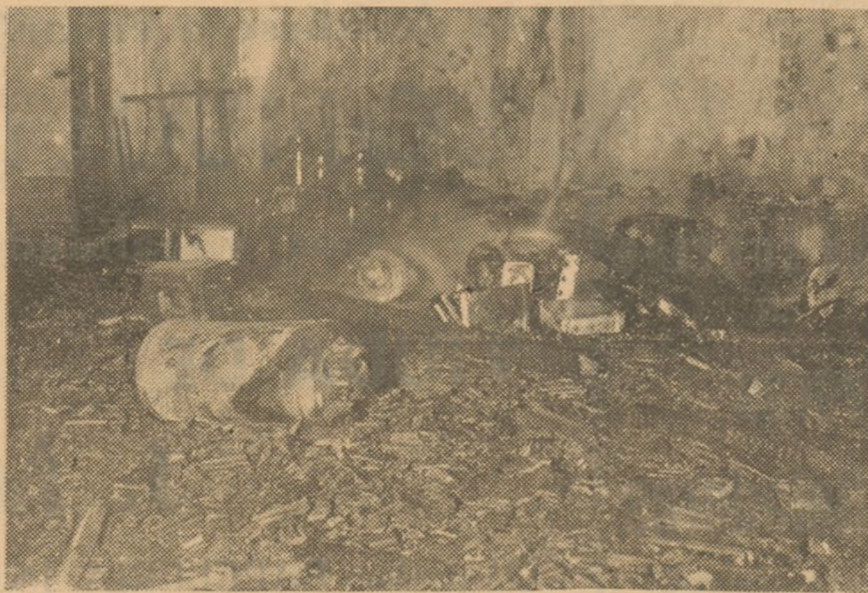
Un fuerte incendio se declaró hace unos días en la fábrica de aparatos cinematográficos y aparatos de radio A. E. G. de Madrid, domiciliada en la calle del General Palanca causando pérdidas de consideración. Estado en que quedaron los aparatos.