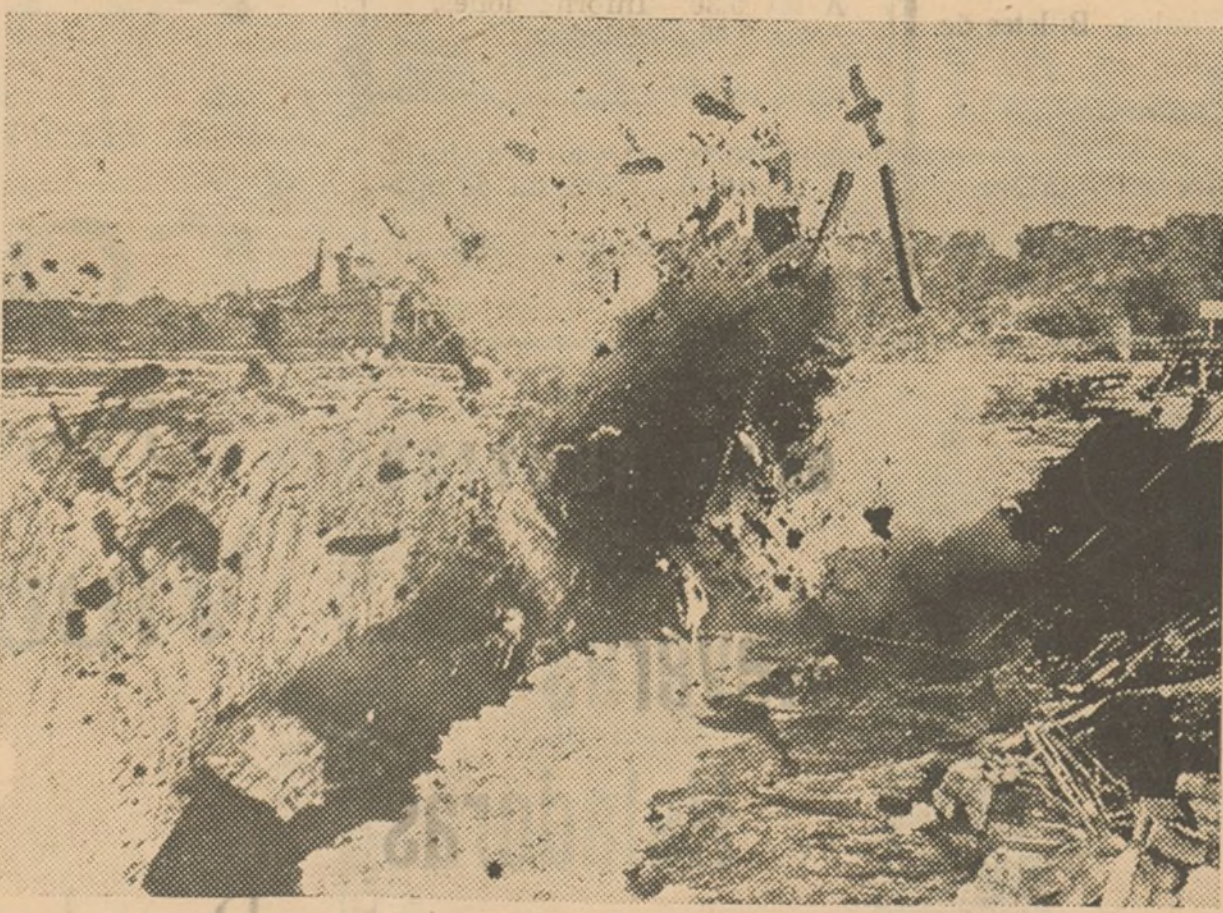
Desde algún tiempo a esta parte se venían observando grandes rajamientos en un banco de arena saliendo de las Cataratas del Niágara; pensando que esto constituía un gran peligro, se ha suprimido la parte peligrosa con una buena carga de dinamita