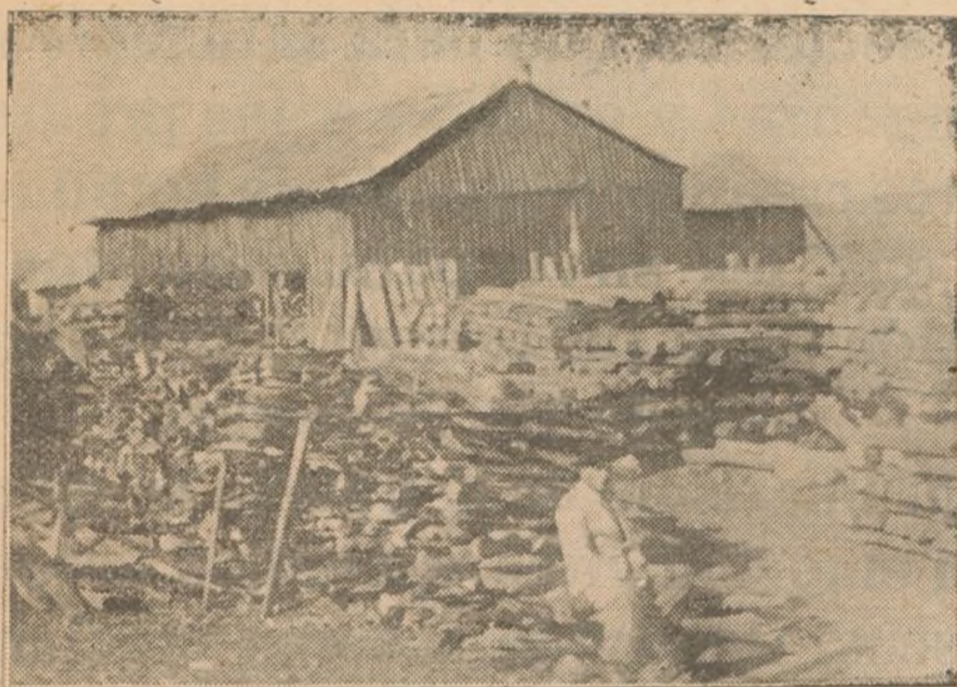
Un aspecto exterior de la Fábrica --Aljaraque-- en una de sus épocas de elaboración