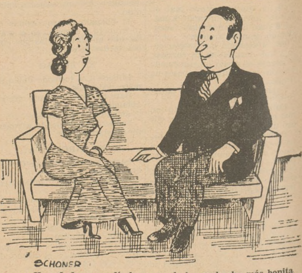
--He soñado que pedía la mano de la muchacha más bonita del mundo. --¡Ah! ¿Y qué contesté yo? (De "Ric et Rac", de Paris.)