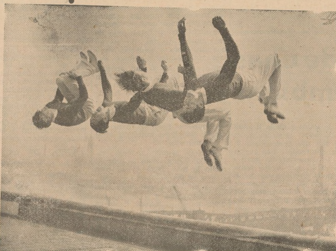
Desde lo que fué el hermoso e histórico puente de Waterloo, el punto de más tráfico de Londres y del que después de doce meses de trabajos de demolición ha quedado solamente un esqueleto, unos atletas se arrojan al Tamesis haciendo acrobacias.