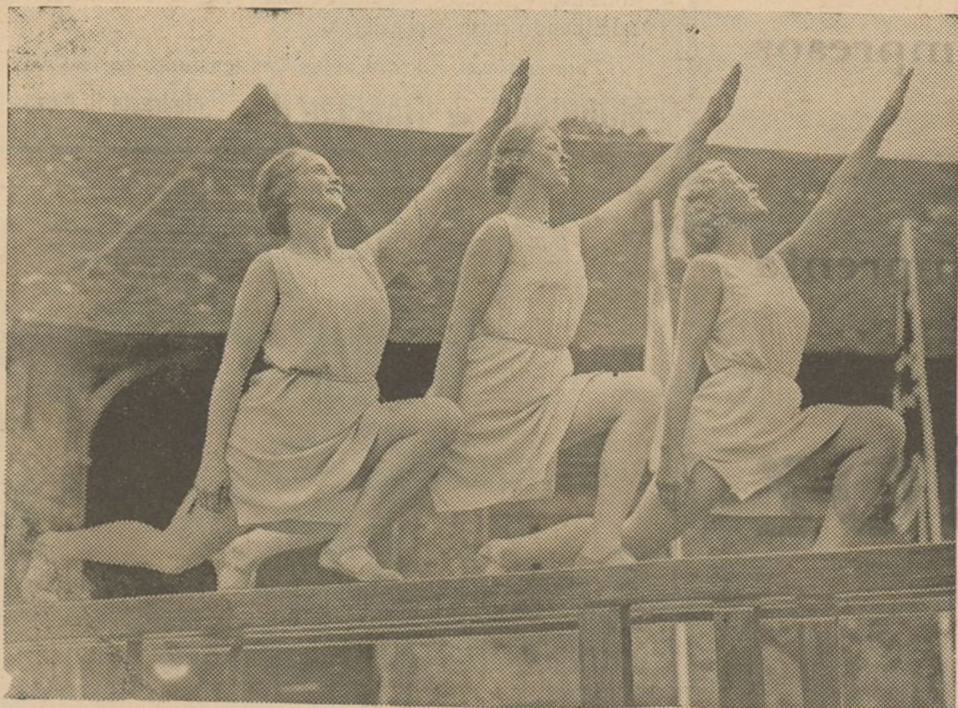
En Sturte, cerca de Canterbury se ha celebrado el anual Congreso de educación física tomando parte bellas concurrentes del mundo entero.

Tres beldades entusiastas de la gimnasia