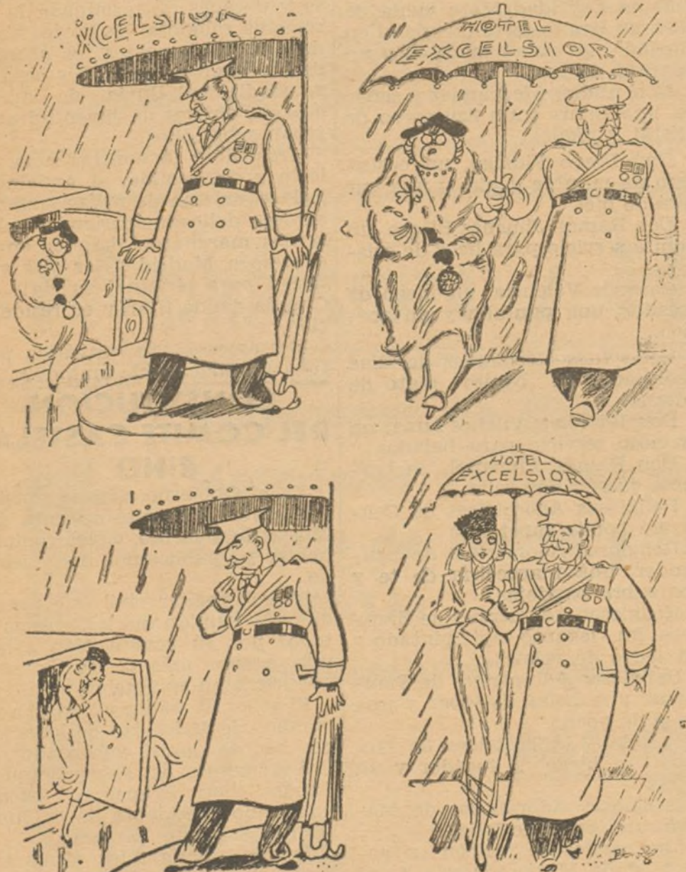
PARAGUAS A LA MEDIDA