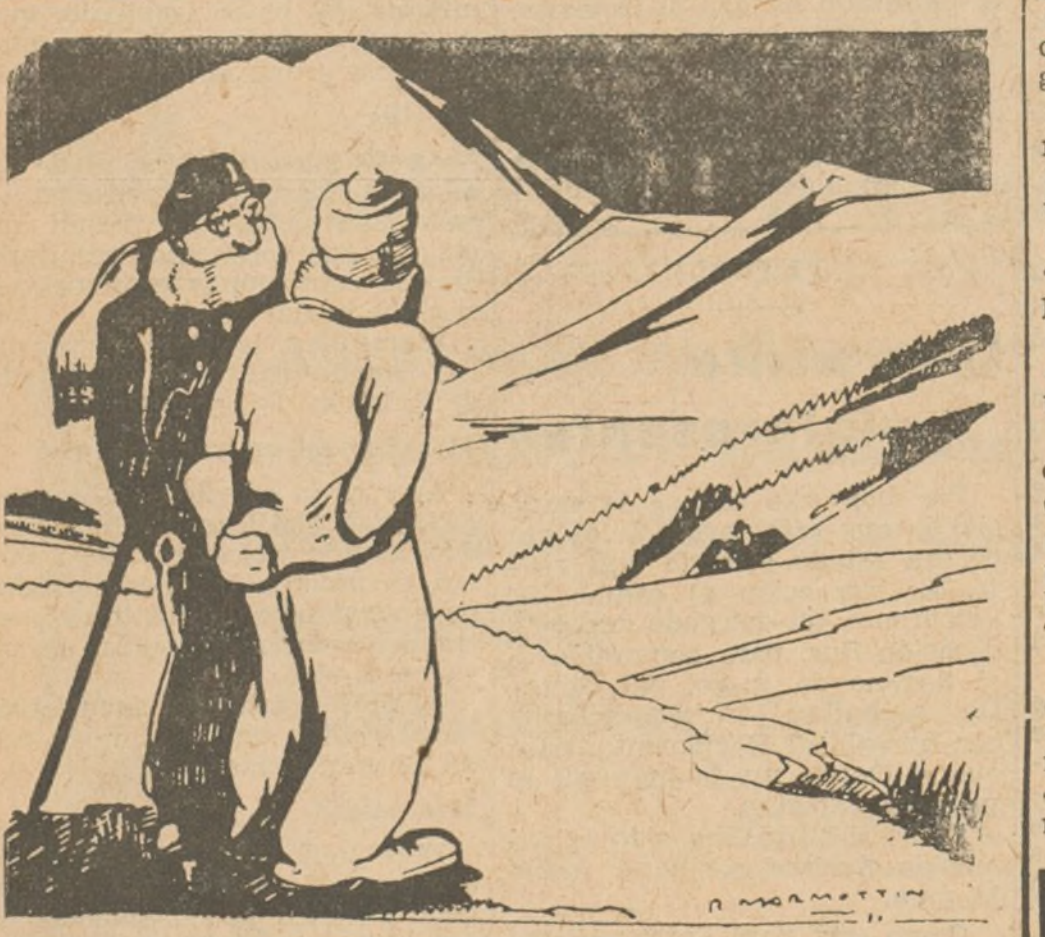
--Es que el Gobierno no hace nada para atraer a los turistas. Vea usted: el mismo paisaje que el año pasado. (De "1935", de París.)