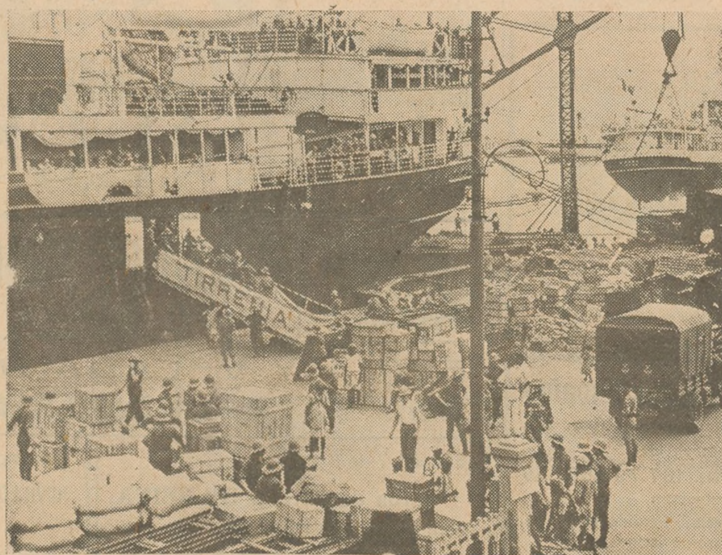
Llegada de provisiones, armas y coches al puerto-fortaleza italiano de Massowak, pues Italia prepara y equipa a miles de soldados que diariamente manda allí.

A las cinco y media se emprendió la marcha para terminar la etapa en Sevilla. Este recorrido se hace bien y el paso por Ginebra y Castilleja no tiene nada notable.