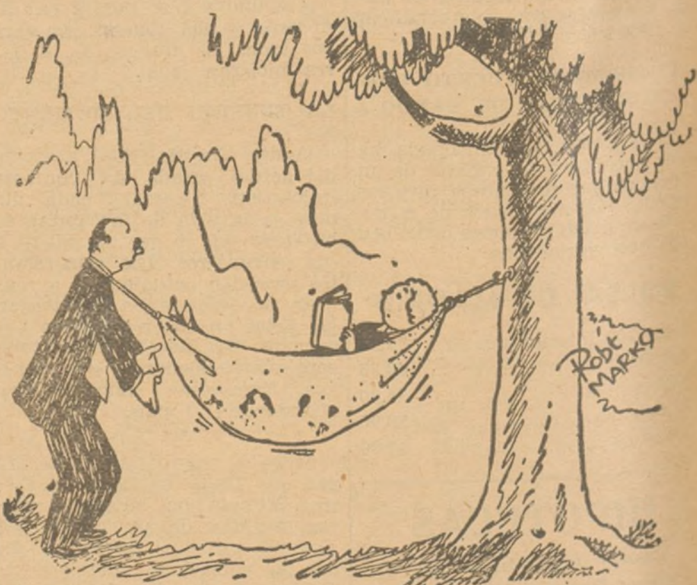
--Creo que debiéramos plantar otro árbol. ¿No te parece, querida? (De "Everubody's", de Londres).