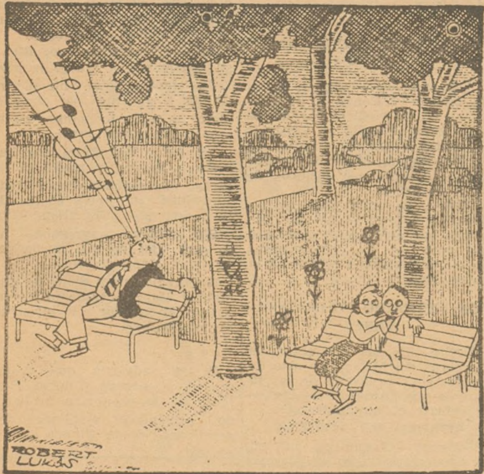
PRIMAVERA. AMOR Y ANUNCIACION Ella:—¿Oye el canto del ruiseñor, querido? (De "Bas Interessante Blatt", de Viena).