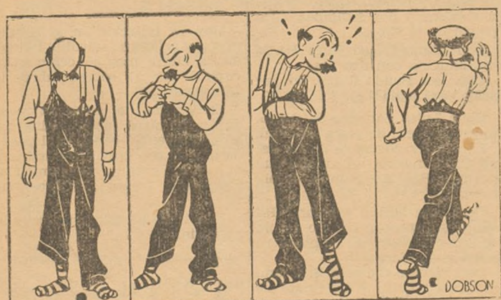
TIRANTES NUEVOS (De "Passing Show", de Londres)