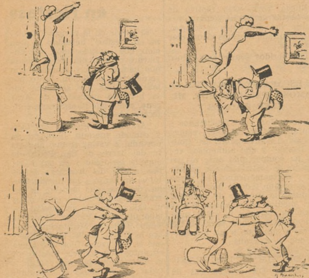
EL SEÑOR MIOPE EN EL MUSEO