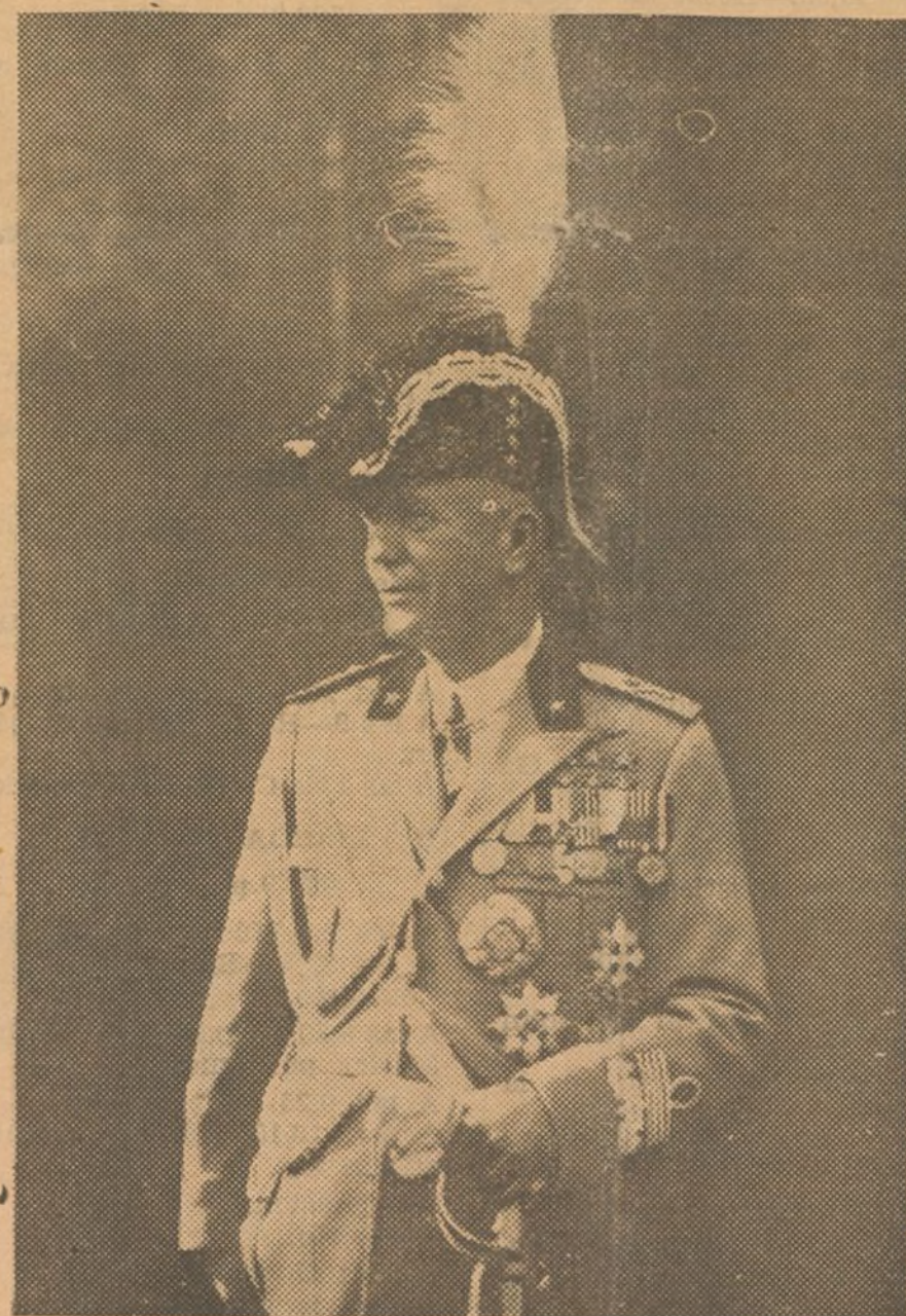
El jefe del Estado Mayor de Italia, general Badoglio, ha recibido uno de estos últimos días el Gran Cordón de la Legión de Honor, la más alta distinción de Francia